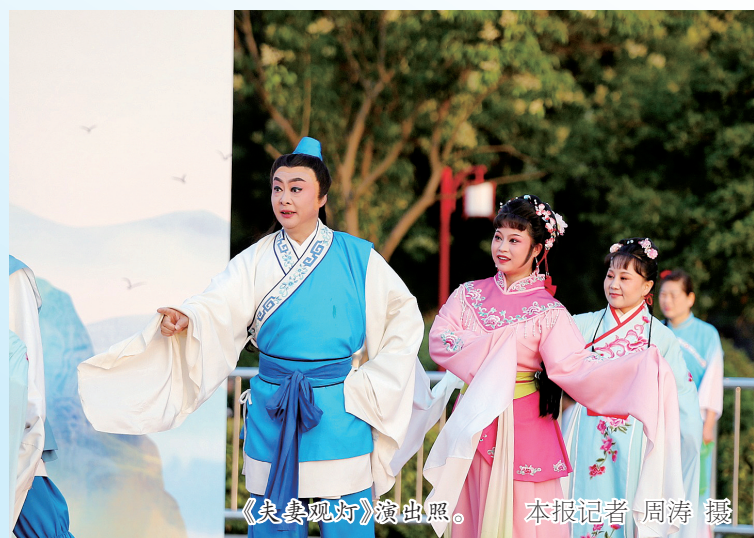
《夫妻观灯》演出照。