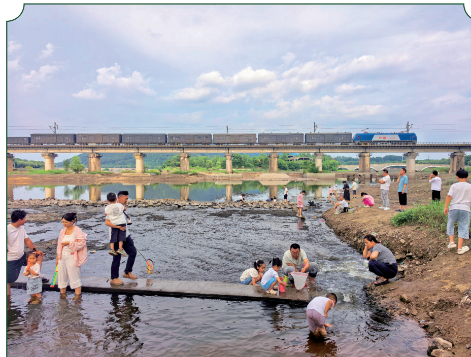
连日来，浙河畔京广铁路桥下，平缓的浅滩成为市民带娃消暑的宝藏地。孩子们卷起裤管踩水花、捞小鱼，家长在岸边纳凉陪伴。头顶列车隆隆驶过，脚下河水潺潺，清凉与欢笑交织，绘出生动的夏日亲子时光。

主办方特别提醒，本次报名严格对应各课程年龄限制，每名学员限报一门课程。请家长结合孩子暑期行程谨慎报名，无故缺课累计3次及以上的学员，将被取消下一年度公益培训报名资格。本次招生录取结果将于7月3日在“信阳市文化馆”官方公众号公示，请家长及时关注官方通知。