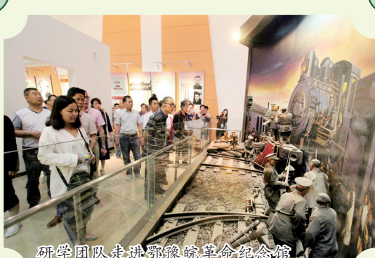
研学团队走进鄂豫皖革命纪念馆

线路一：文新茶村（信阳毛尖茶、毛尖茶制作技艺）—柳林老街（地锅豆腐制作）—郝堂村（郝堂八大匠）；线路二：灵山（罗山皮影戏、大汤汤、猪油馍）—光山东岳村（光山花鼓戏、司马光砸缸故事）—新县田铺大湾和丁李湾（新县刺绣、地灯戏、新县民歌）—商城平安驿·逗街（商城民歌、花伞舞、商城地菜）—商城郭窑小镇（陶器制作技艺）—固始根亲文化园（花挑舞、灶戏、固始鹅块）；线路三：潢川县（空心贡面、双柳鱼丸汤、锣鼓十八番）—息县（息夫人传说、油酥馍、包信大饼）—淮滨走读淮河文化园（孙叔敖故事、淮滨泥塑、淮滨木船船模制作技艺）。