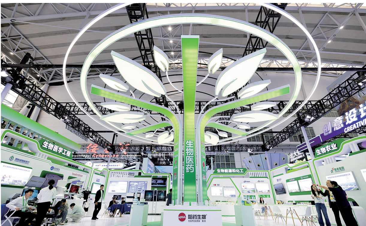
5月17日，参会者在第十届中国—俄罗斯博览会现场参观。5月17日，第十届中国—俄罗斯博览会迎来公众开放日。第十届中国—俄罗斯博览会主题为“信任、合作、共赢”，由商务部、黑龙江省人民政府、俄罗斯经济发展部、俄罗斯工业和贸易部共同举办。本届博览会展览总面积5.5万平方米，46个国家和地区1500余家中外企业参展。

关爱，不止于助残日。唯有守住真实的底线，珍惜每一份共情，才能让网络空间的善意自由流淌，现实的温暖真正落到实处，最终化作持之以恒的文明自觉。(记者：李明辉、魏冠宇)(新华社北京5月17日电)