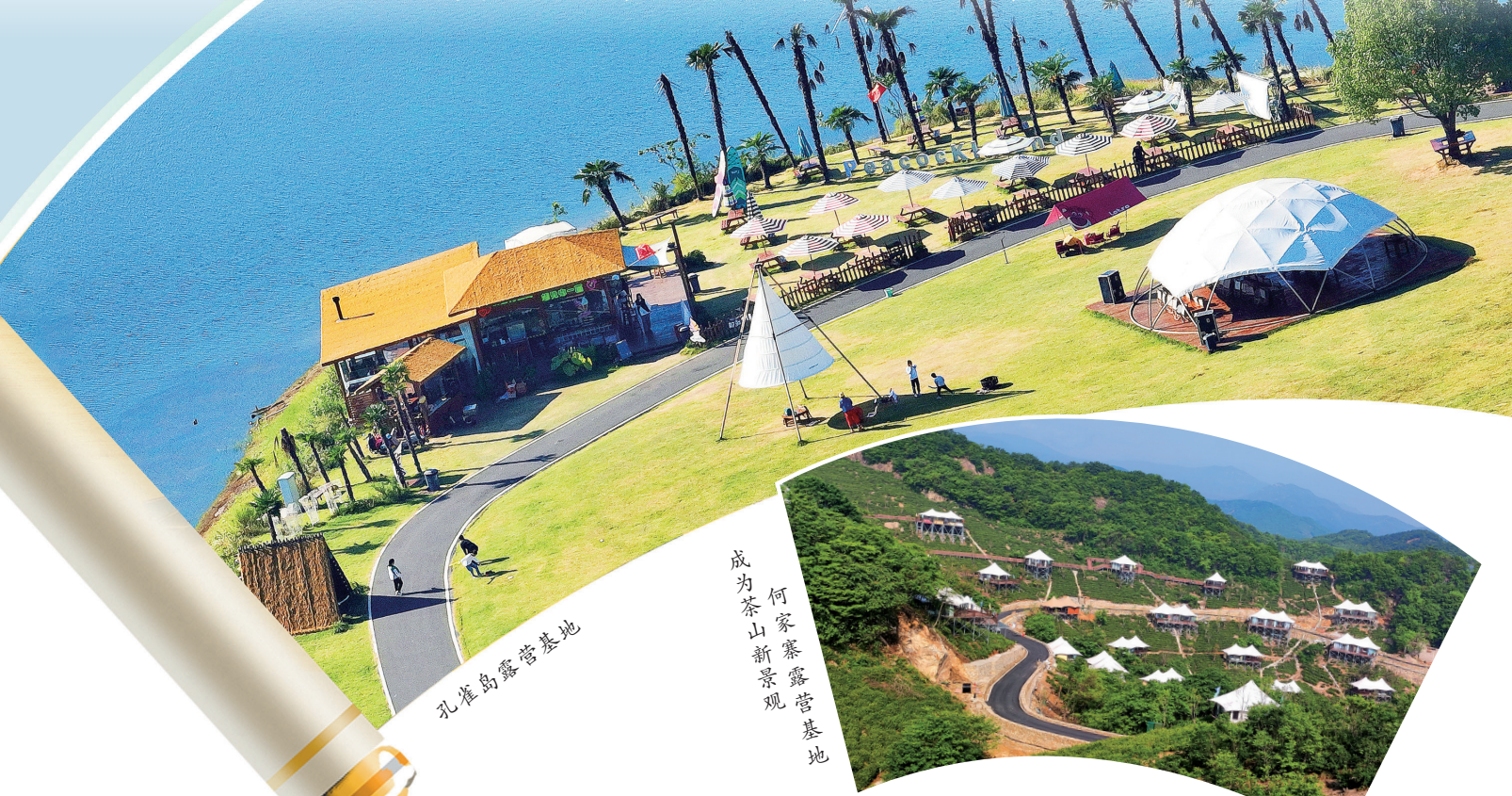
成为茶山新景观 何家寨露营地 孔雀岛露营地