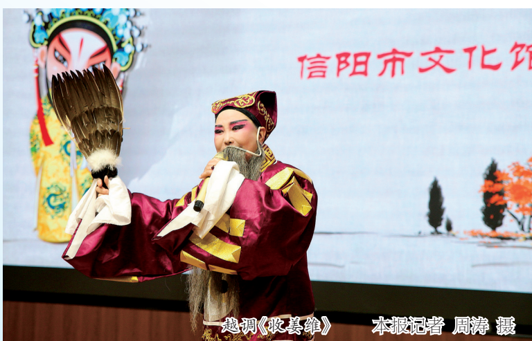
越调《救母记》

由河南民间说唱艺术——鼓子曲发展演变而成，唱腔委婉清新，表演细腻活泼。《卷席筒》中“小舍娃”的经典唱段，以其幽默诙谐、口语化的特色，道尽小人物的悲喜，极易引发共鸣。曲剧擅