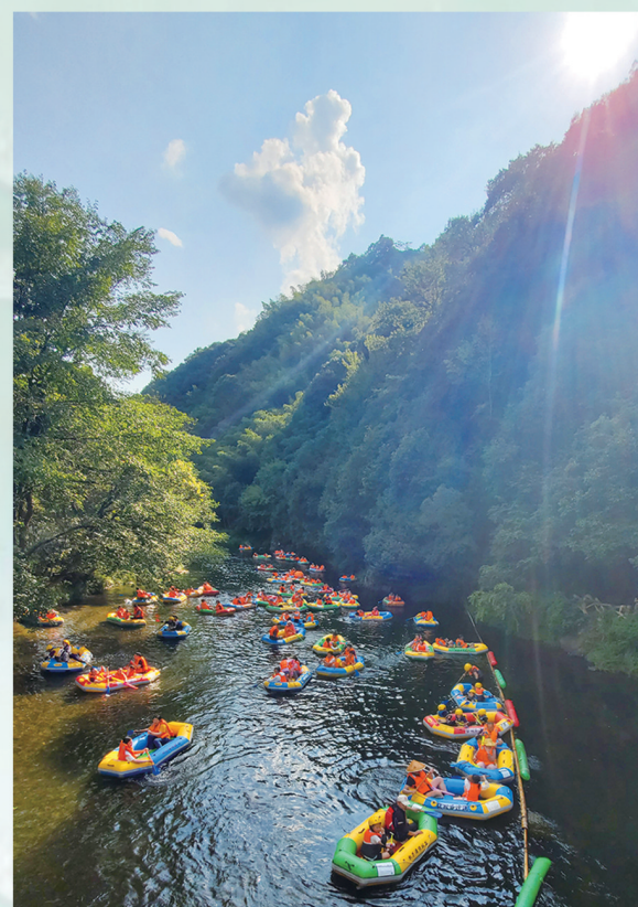
夏天来了 安徽宣城