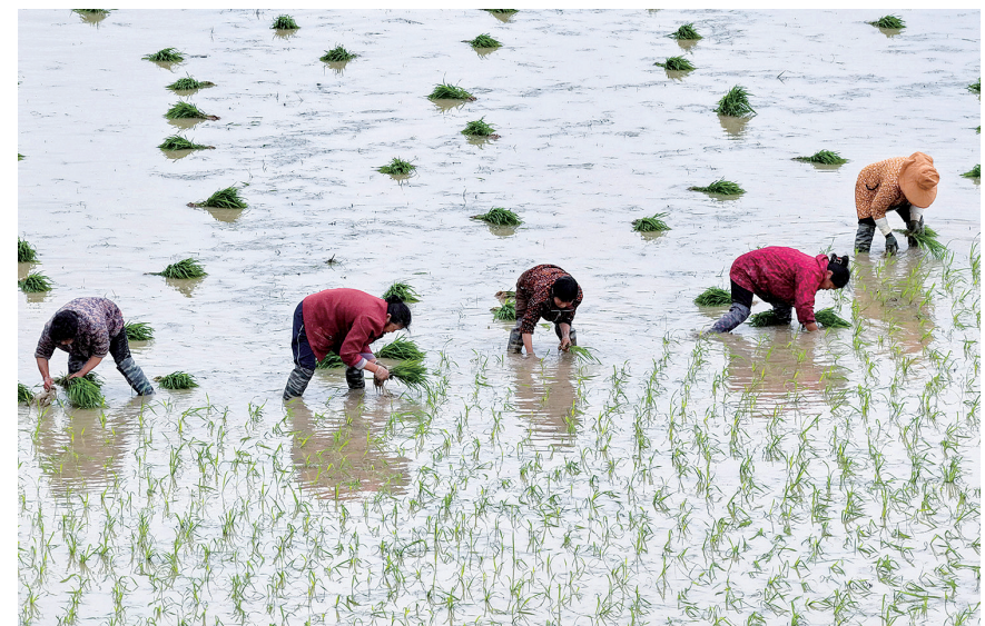
近日,光山县斛山乡梅岗村的稻田里,农户们抢抓农时开展人工水稻插秧作业,一行行秧苗在水田中铺展开来,勾勒出一幅生机盎然的农耕画卷。