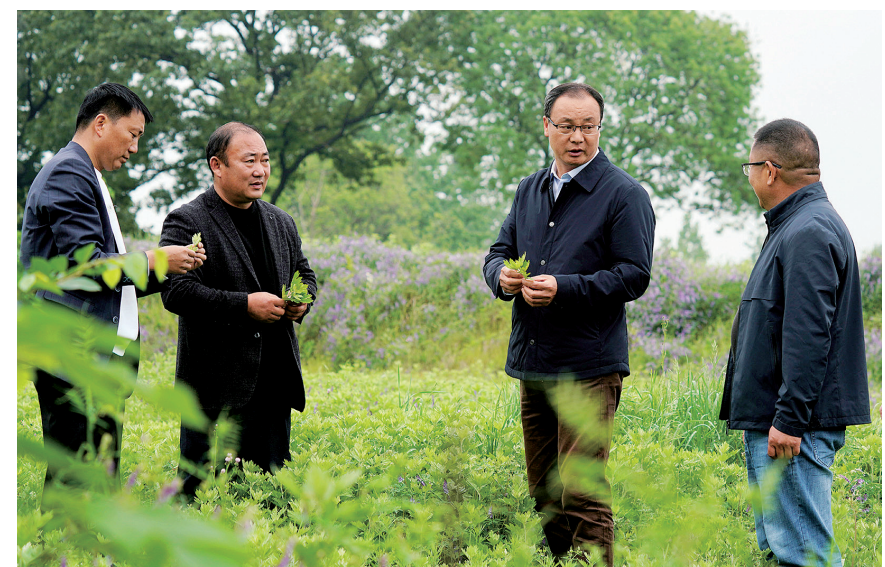
近日,平桥区政府、洋河镇有关负责同志到洋河镇陈畎村艾草种植基地了解艾草生长情况。据了解,近年来,陈畎村坚持以产业振兴带动乡村振兴,依托本地农业资源,培育壮大特色种植产业,推动村域经济稳步发展,带动村民持续增收。

下一步,双方将以此次调研为契机,持续加强沟通协作,聚焦油菜产业高质量发展需求,在品种选育、技术集成、成果转化等方面开展深度合作,携手破解产业发展瓶颈,推动油菜产业提质增效,为保障粮油安全、助力乡村振兴注入科技动能。