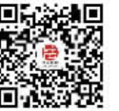
信阳法制微信公众平台