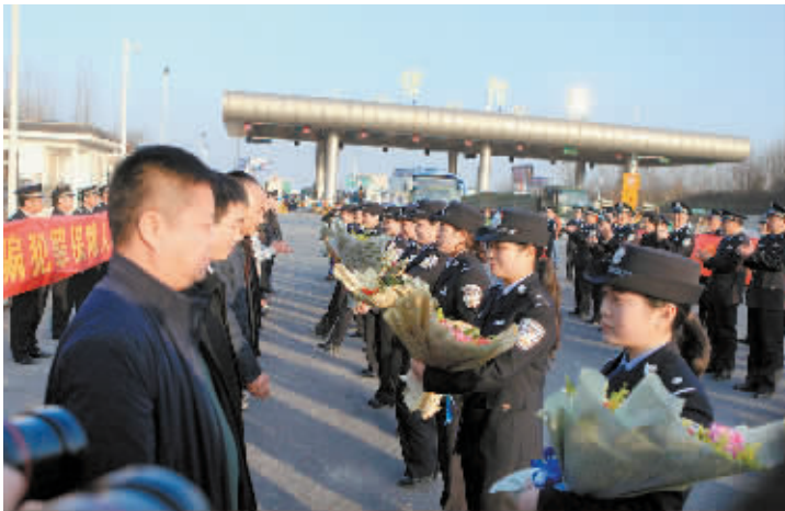
图为追捕组凯旋欢迎仪式现场。