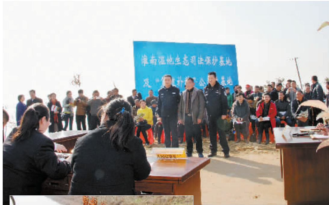
12月7日上午,淮滨县法院“淮南湿地生态环境司法保护示范基地”及“复植补种公益林基地”揭牌仪式举行。活动中,淮滨县法院环境资源巡回审判庭公开宣判了两起滥伐林木案件,当事人均表示服判并按法庭要求现场复植补种。

严格监控结果运用,树立案件流程监管权威性。该院实施重点案件检委会监控制度,案管办负责人列席检委会,对重大、疑难、复杂案件讨论决议情况提前掌握并发表意见,全面把控重大疑难案件处理流程。实施整改情况通报制度,对于在案件流程监管过程中发现的违规问题当面向部门负责人和有关人员反馈。强化监管结果运用,对于在流程监管中发现超期办案等严重违法违纪情形的,依照奖惩制度予以处理。