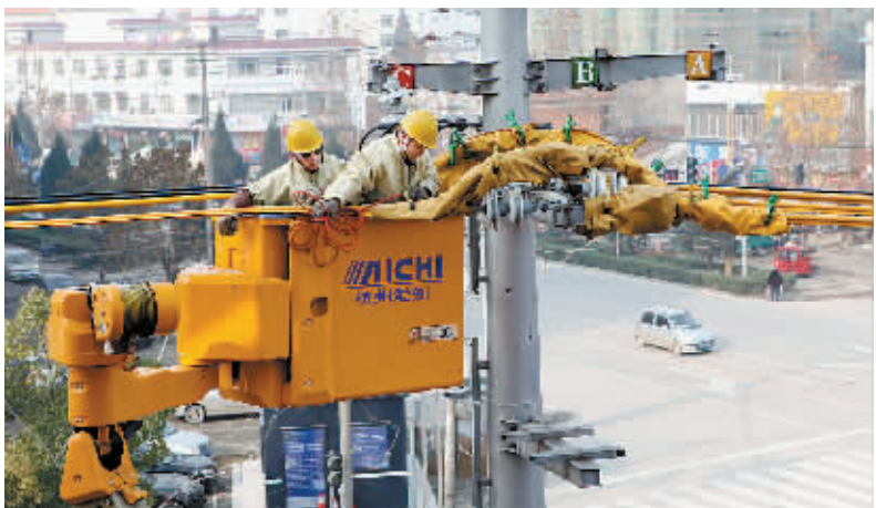
12月4日,在信阳供电公司运维部带电作业专家的指导下,淮滨县供电公司首次采用带电作业技术开展工作,成功实现带电作业“零突破”,为实现优质、方便、快捷、高效的供电服务提供保障。