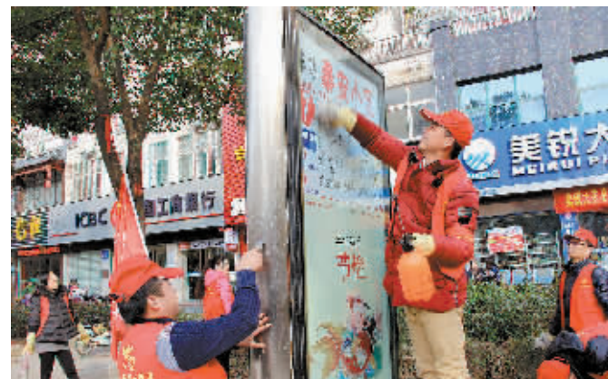
日前,平桥区交通运输局组织志愿者服务队走上街头,开展“清洗公交站牌、擦亮城市窗口”活动。图为志愿者们在平桥区主要路口清洗公交站牌和广告牌。