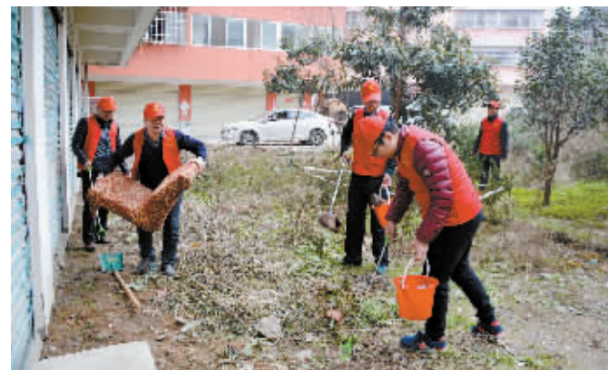
12月3日上午,市道路运输管理局组织18名在职党员深入居住地所在社区浉河区金牛山办事处徐堂社区,开展卫生清洁活动。