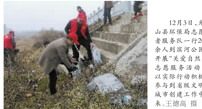
12月3日,光山县环保局志愿者服务队一行20余人到滨河公园开展“关爱自然”志愿服务活动。以实际行动积极参与到省级文明城市创建工作中来。