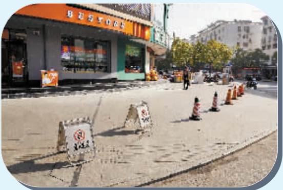
申碑路和北京大街路口抢占停车位