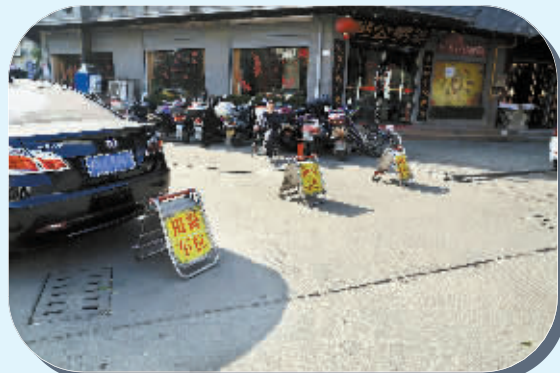
申碑路抢占停车位