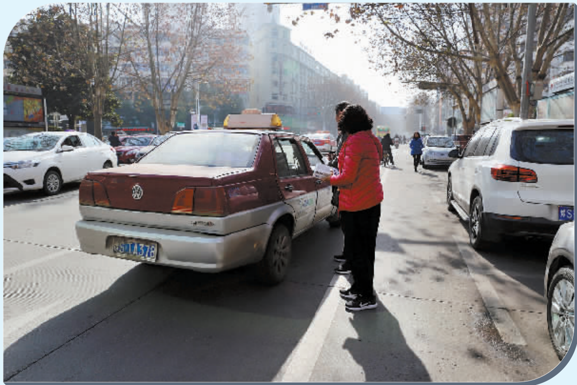
中山街出租车随意停车询问顾客去向