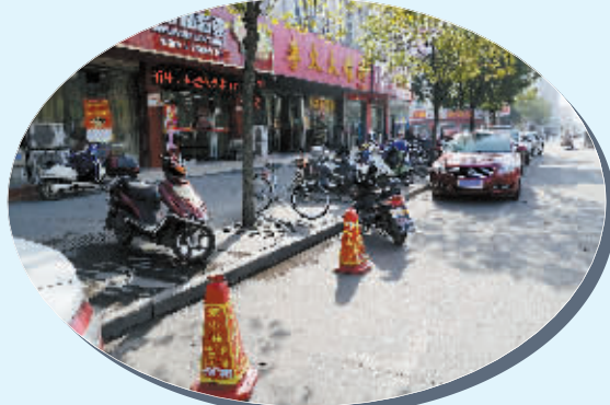
申碑路抢占停车位