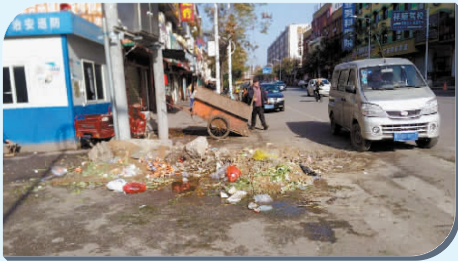
拱桥路四里棚全民菜市场门口的垃圾无人管理

城市是我家,创建靠大家。全国文明城市创建工作开展以来,我市文明之风盛行,城市管理逐步升级,市民素质显著改善。然而,创建工作没有休止符,需全市各级部门和广大市民同心同德,持续发力。目前,文明城市创建仍存在需要完善和改进之处,图为记者走上街头,拍摄的文明创建不完善之处,以示警醒。