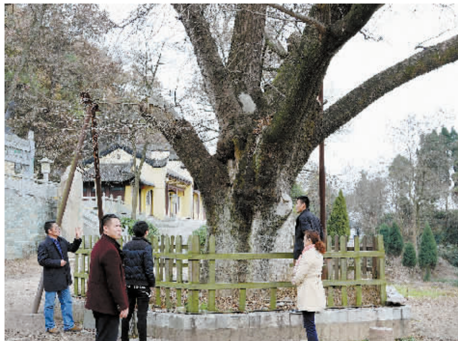
今年以来,光山县净居寺名胜管理区按照政府搭台、旅游唱戏,农民增收的思路,以用活资源、服务游客、农民增收为目的,投入基础设施建设资金8000余万元,探索出一条旅游+扶贫的路子。图为昨日游客在该管理区观看千年同根三异树。

程建设,实行科级干部包村制度,指定村支部书记为冬修水利工作的第一责任人,采取召开会议、悬挂标语、入户走访等形式,大力宣传农田水利建设的重要意义,鼓励群众积极参与冬季农田水利建设。二是按照“谁投资、谁受益”的原则,对村内的农田水利基本建设项目,实行“一事一议”制度,把决策权交给农民群众,精心打造“民心工程”“阳光工程”。三是采取政府奖励、群众自筹、成功人士捐助、项目支持等办法,解决资金难题,在鲍冲、石板沟、蔡湾等村,集中连片开发建设高标准种植基地3000多亩,在李田、高湾、梁湾、胡湾等村修整大塘、沟渠、提灌站。四是充分发挥村民监督委员会的作用,严把工程质量验收关,将农田水利基本建设完成情况作为发展现代农业、促进农民致富增收的一项重要举措。