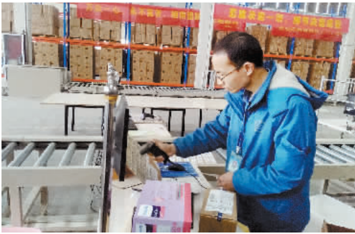
图为鄂豫皖一日达工作人员正在复核商品信息。

日达公司还有更长远规划。今年年初破土动工的占地20万平方米的保税物流中心智能仓库,将日处理快递包裹量能力提高10倍,达到50万件以上,并依托集聚的跨境电商电子商务企业,开展跨境电子商务,真正使信阳实现“买全球、卖全球”,也将引领着我市物流行业的快速发展。