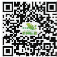
健康信阳 微信公众账号