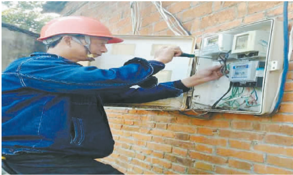
连日来,按照《光山县供电公司2016年迎峰度冬及“双节”保供方案》要求,该公司认真落实运维管理制度层面的各项措施,全力推进配网消缺工作,确保度冬期间安全可靠供电。图为11月8日,该公司紫水供电所台区管理员正在清华园小区开展下户线改造工作。

马富增强调,“两学一做”学习教育,基础在学,关键在做,要突出问题导向,学要带着问题学,做要针对问题改。要紧密联系实际,尤其是要联系河南省加快中原崛起、河南振兴、富民强省的目标地位,联系我市“十三五”期间经济社会的发展战略,紧紧围绕我市大气污染防治攻坚战以及当前的环境保护及生态建设工作形势,全局党员干部都要以对党和人民高度负责的精神,勇于开拓创新,锐意进取,通过自我加压,提高业务水平,发挥模范带头作用,为经济社会又好又快发展作出应有贡献。 通过此次党课学习,市环保系统全体党员干部进一步加深了对“两学一做”学习教育的领会,对全体党员增强党性意识、提升党性修养、提高廉洁从政意识、争做合格党员,起到了很好的促进作用,也增强了全体党员干部廉洁自律的自觉性和做好本职工作积极性、主动性。