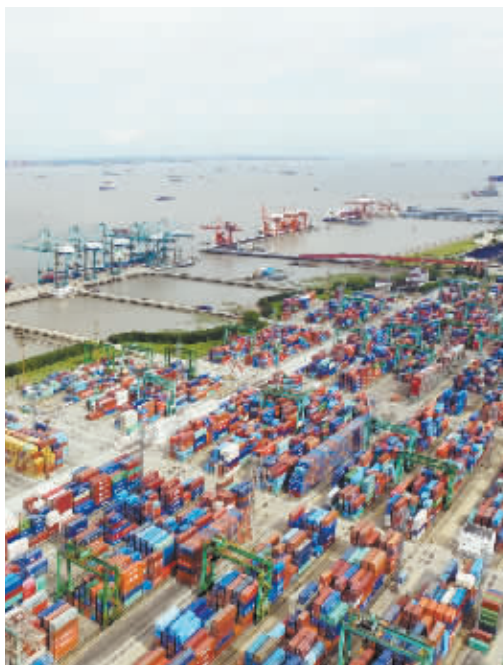
中央政治局日前召开会议分析研究当前经济形势和经济工作，提出确保实现今年经济社会发展预期目标，确保实施“十三五”规划良好开局。

会上，国务委员王勇宣读了习近平重要指示和李克强批示，5位受表彰代表作了发言。中央和国家机关有关部门负责同志，各省区市、计划单列市和新疆生产建设兵团安监局以及各省级安全监管局负责同志等参加会议。