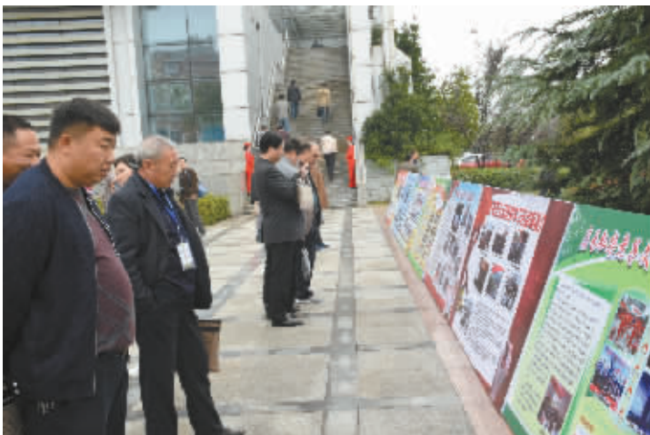
本周是河南省暨信阳市全民终身学习活动周,我市以各种形式向市民宣传终身学习的重要性。上图为学生们朗诵《少年中国说》。左图为市民们在观看全民终身学习活动周展板。