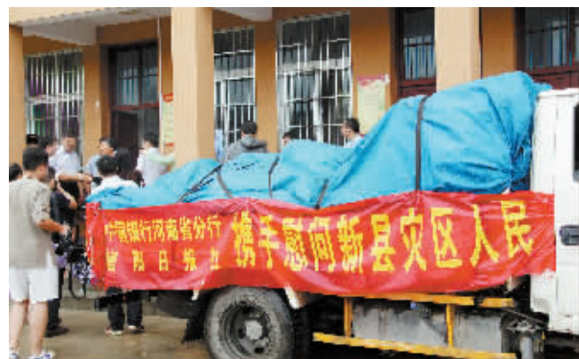
信阳中行向新县田铺乡捐赠10万元救灾物资