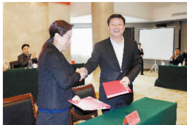
信阳中行与淮滨县政府签约