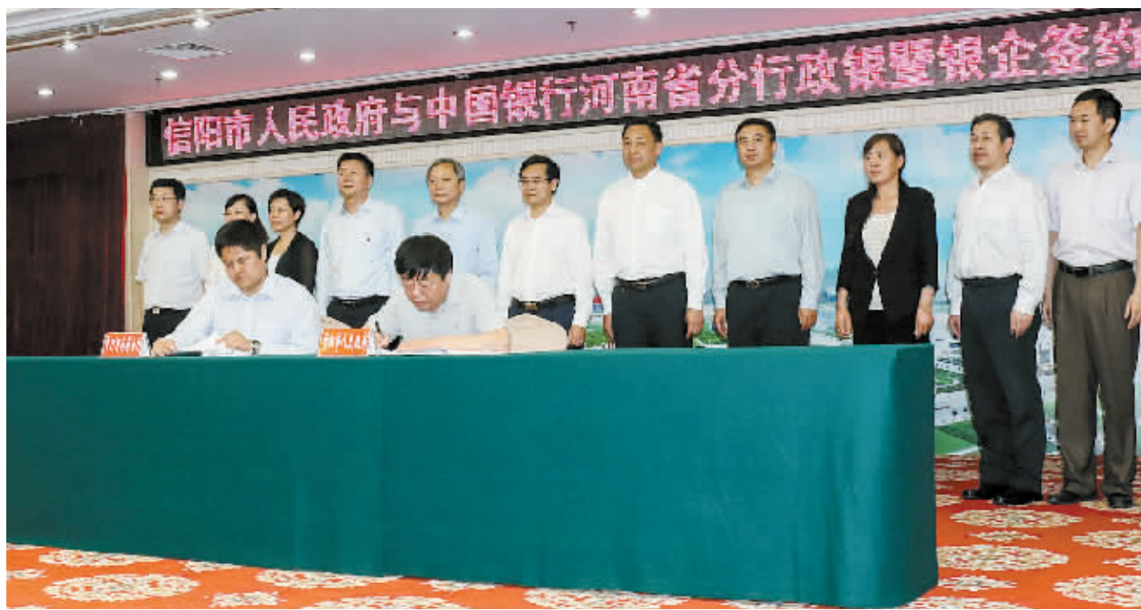
市政府与中国银行河南省分行举行签约仪式

在全面贯彻落实市委、市政府各项工作部署及经济工作会议精神中,该行强化政治担当,抢抓机遇,创新金融服务,为助力我市建设“一市一区三枢纽”作出了巨大贡献。先后被市委、市政府和市银监局及上级行表彰为“目标管理先进单位”“政风行风建设先进单位”“A级纳税人”企业等。