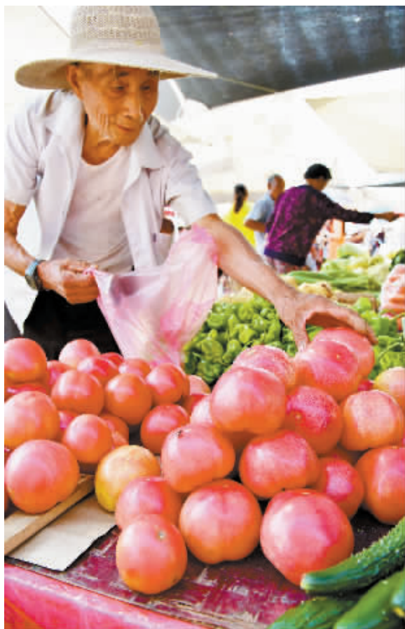
2016年8月份CPI同比上涨1.3%。9月9日,山东枣庄市山亭区居民在农贸市场买蔬菜。当日,国家统计局发布报告,8月份全国居民消费价格指数(CPI)同比上涨1.3%。

作为目前我国唯一的国家级、国际化专利技术品牌展会,中国国际专利技术与产品交易会自2002年创办以来,已经成功举办9届,共有上万家厂商、8.2万余件专利参展交易。本届专交会设11个展区,除国内外的大学、科研机构、企业外,俄罗斯、美国等24个国家和地区参展,5500多个项目进行展览展示。