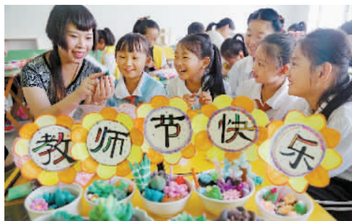
9月9日,河北省秦皇岛市临河里小学的老师和学生一起制作彩泥多肉盆景,为全校老师送上教师节的祝福。当日,各地学校组织丰富多彩的活动,迎接教师节。新华社记者 杨世尧 摄