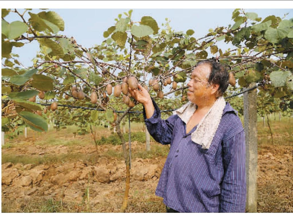
昨日,在淮滨县栏杆街道办事处东乡村富淮猕猴桃种植专业合作社,技术人员正查看猕猴桃长势。据了解,该合作社种植绿色猕猴桃500多亩,有黄金果、东红、金艳、蜜桃等品种,9月底可采摘上市。东乡村是国家级贫困村,近年来通过特色种植,逐步使村民走上脱贫致富之路。