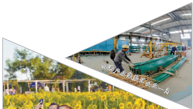
明港产业集聚区企业一角