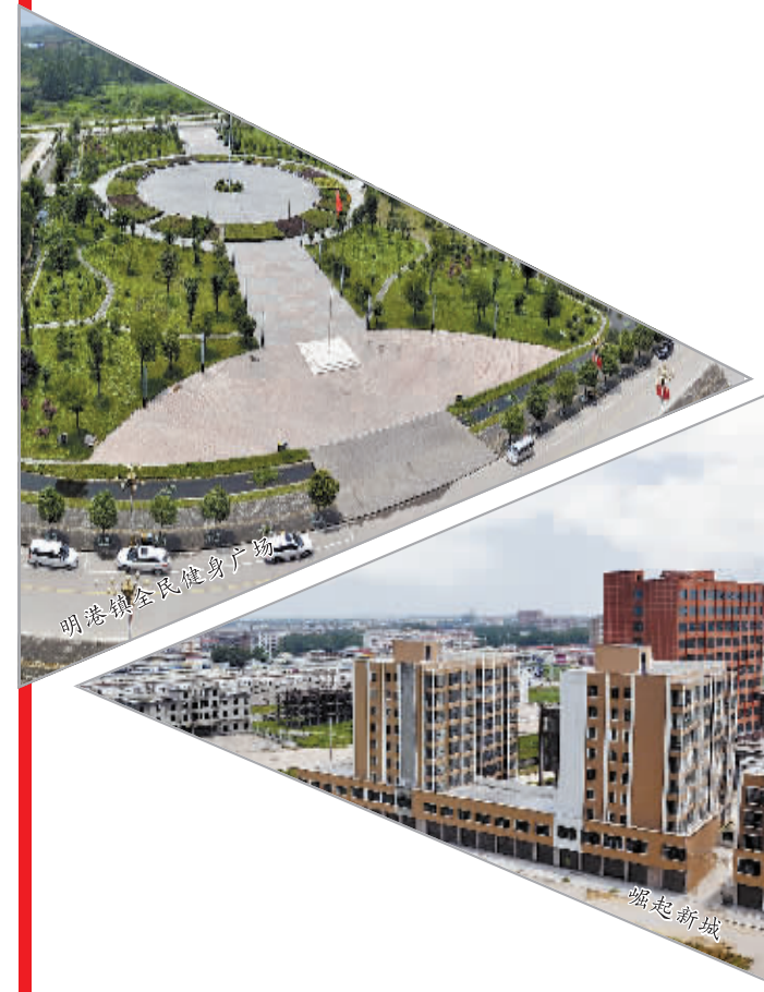
明港镇全民健身广场