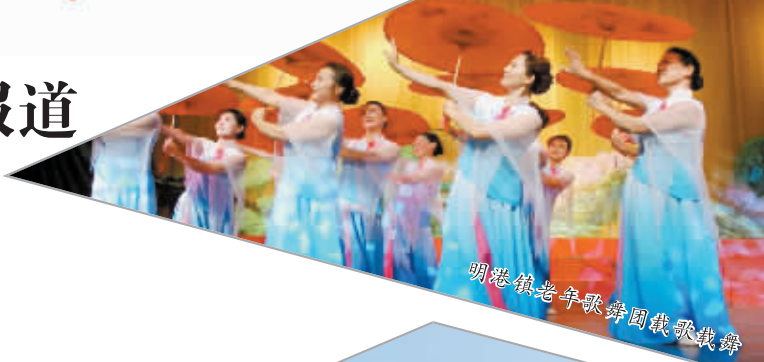
明港镇老年秧歌队载歌载舞