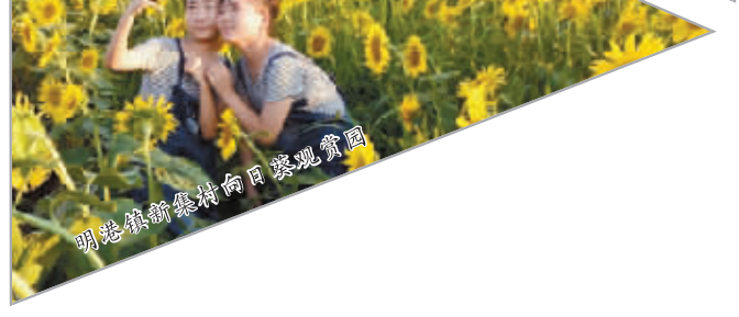
明港镇新集村向日葵观赏园