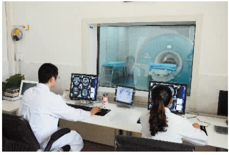
图为磁共振操作现场。

微笑服务、轻声细语,把每一个住院的病患当作自己的亲人……这些更加人性化的服务在新县人民医院早已司空见惯。从医务人员的一言一行,可以感受到这所人民医院为人民的服务宗旨。“护理工作在很大程度上关系着病患对医院的印象。既然