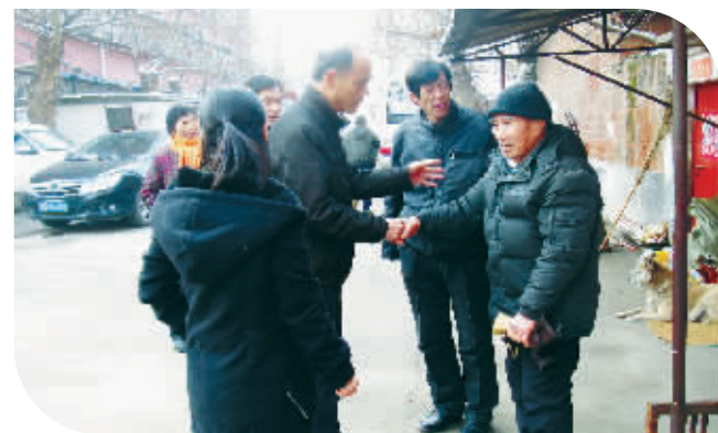
走访慰问孤寡老人

三是始终坚持“以人为本”理念,紧紧围绕新区下达的工作目标,加大计划生育工作力度,加强政策宣传,提倡优生优育,严格控制人口出生率和出生人口性别比例,加强了对育龄妇女和失独家庭的慰问与关怀,强化为民服务意识,计生工作连续5年被评为“一类单位”。