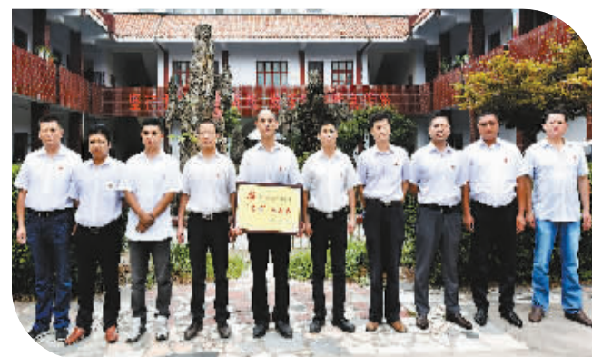
荣获“五好党工委”称号

会制度、居务公开制度、年度述职述廉、民主测评和党员评议等制度,使党组织的创造力、凝聚力、战斗力不断增强。二是切实加强党风廉政建设。制定了《南京路办事处管理制度汇编》,完善了廉政建设责任制,以制度管人,按规矩办事,坚持标本兼治,强化监督,防微杜渐,使廉政建设在制度和措施上不断落实,从源头上堵住了腐败现象的产生,呈现党风正、政风清、作风优、民风淳的良好工作局面,实现了南京路路路畅通、办事处处处兴隆。