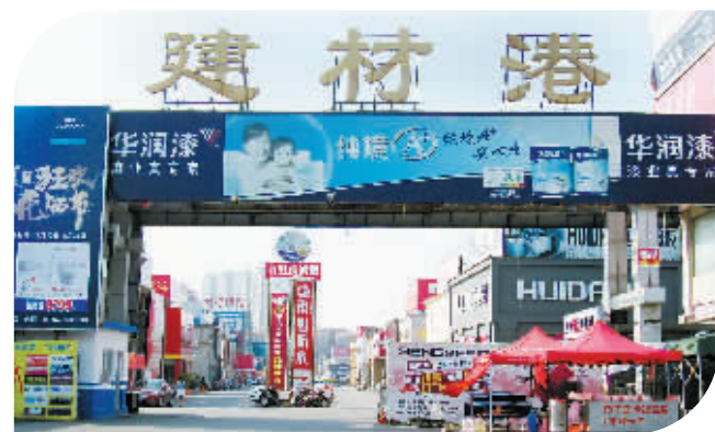
豫南最大的建材市场

14.19亿元,实交税金1218万元,利润总额5113万元,实现限额以上企业营业收入78216万元,实交税金1156万元,利润总额973万元,与2011年同期相比,分别增长35.93%、135.33%、107.96%、37.01%、140.26%、32.66%、41.32%、22.10%,完成财政收入1522万元,与2011年同期相比,增长38.36%。