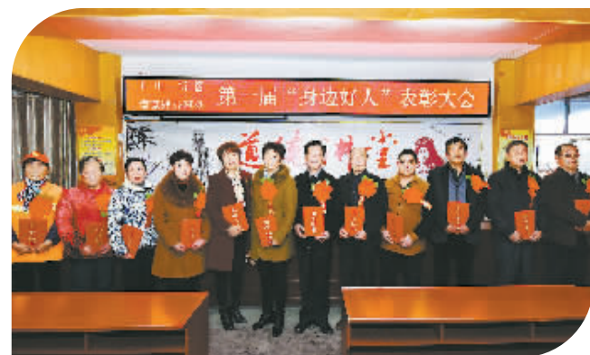
身边好人评选表彰

全覆盖,大力开展社会管理综合治理,积极开展“扫黄打黑”专项整治行动,不断增强社会治安防控能力。四是改善辖区办学条件,提高教学质量,积极开展校园安全整治活动,完成九年制义务教育任务。五是加强拥军优属工作。全力支持国防和军队建设,促进军政、军民团结,积极做好优抚安置和退伍士兵档案清查工作,严格落实征兵条例,坚持依法征兵、廉洁征兵,组织优秀青年参加兵役体检,为部队输送优质新兵36人。