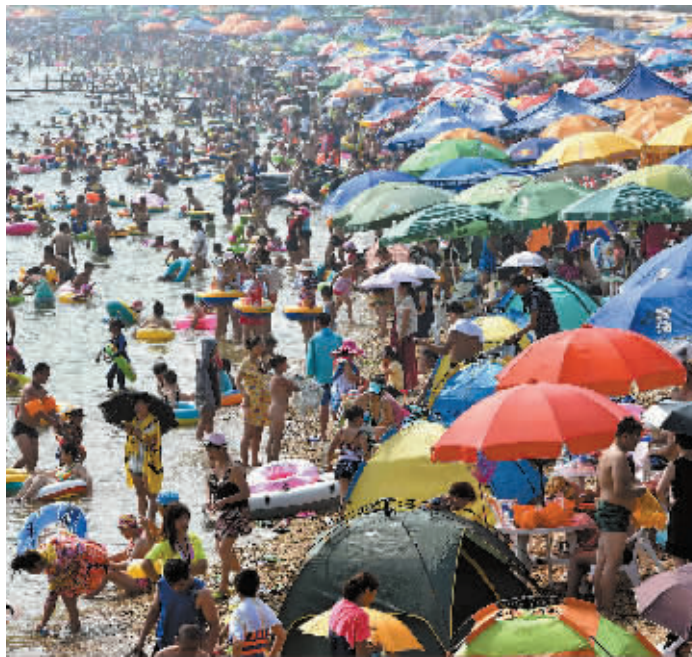
7月28日,游客在辽宁大连付家庄海滨浴场戏水消暑。