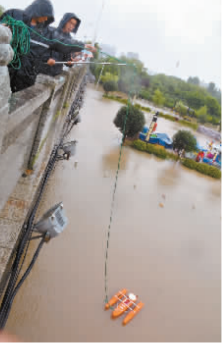
7月20日,市水文局技术人员在琵琶桥上测量浉河水流速度和流量。