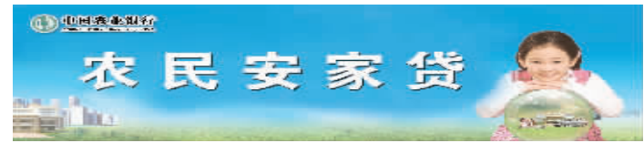
责编:陈晓军 审读:保仓 组版:徐冉