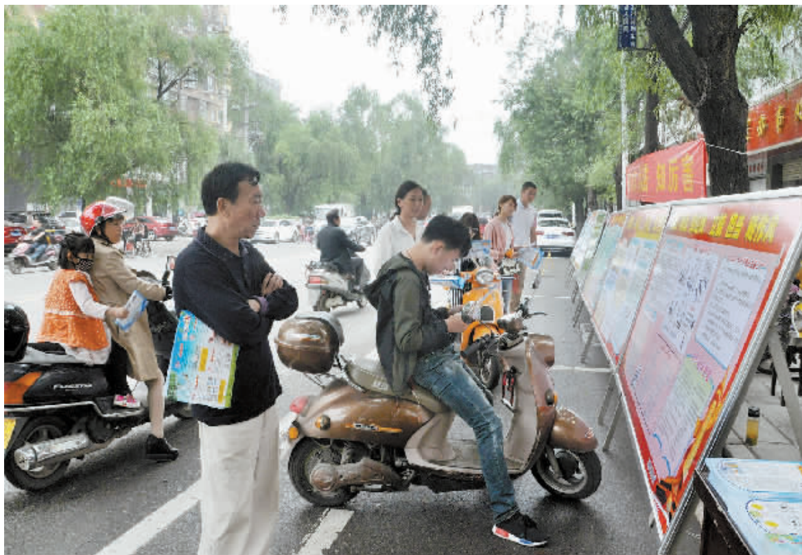
6月8日,浙河区五星办事处在河南路举行了“安全生产月”宣传一条街活动,通过展板、横幅、宣传单、咨询台等形式,向过往群众宣传安全生产法律法规和各类安全知识,现场解答群众在生活中遇到的有关安全生产方面的疑问,受到群众一致好评。图为活动现场。本报记者 马保群 摄

本报讯(见习记者 周雅娟) 为全力做好2016年我市夏季消防安全工作,6月8日上午,我市召开夏季消防安全检查暨火灾警示宣传教育月电视电话会议,市政府副市长谢天学出席会议并讲话,相关部门负责人参加了会议。 谢天学指出,要认真组织消防安全隐患排查,做到不留死角。全面排查整治重点场所和领域,同时加大消防安全知识宣传,使消防安全意识深入人心。要扎实开展消防安全隐患排查,做到不留尾巴。结合夏季火灾规律和特点,对重点场所和领域加强防火、用电管理等安全防范措施。 谢天学强调,要严格落实消防安全“三个责任”,做到不走形式。加强组织领导,强化督导检查,明确工作责任。使消防安全真正得到人人有责,人人负责。要依法处置消防安全违法行为,做到不能手软。要严格落实责任追究,坚决克服懈怠情绪和麻痹思想,确保我市消防安全形势持续稳定。