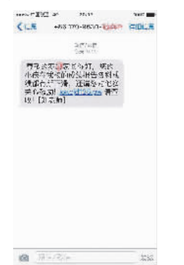
图为家长收到的疑似病毒的“校讯通”信息。

记者调查发现,此类短信诈骗,不法分子在短信文字上下足了功夫,千方百计诱使用户点击链接。目前收到此类诈骗短信的学生家长,有个别家长疏忽大意点击网址,由此甚至造成财产损失。记者提醒广大手机用户,收到带链接的短信务必提高警惕,确认安全后再点击,建议安装手机杀毒软件,养成定时查杀病毒的习惯。