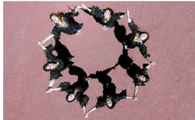
5月29日,沈阳农业大学的学生们在校内拍摄毕业照。又到一年毕业季,沈阳农业大学的学生们利用无人机拍摄各式创意毕业照,为青春留下美好的回忆。