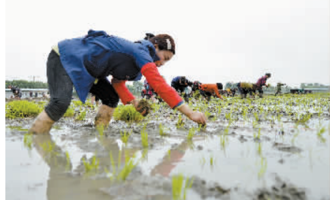
5月29日,一场主题为“绿色生态、有机种植”的手工插秧比赛在江苏省沭阳县沭河镇农田举行。人们按照传统的水稻插秧技法,进行手工插秧技艺的比拼,重拾田间乡土情。