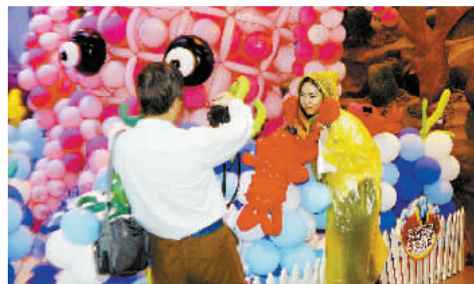
5月28日,一场海洋主题的气球嘉年华会在上海欢乐谷举行。五彩缤纷的气球组成各种海洋生物造型,众多游客在超过一万平方米近百万只气球组成的气球海洋中尽情欢乐。