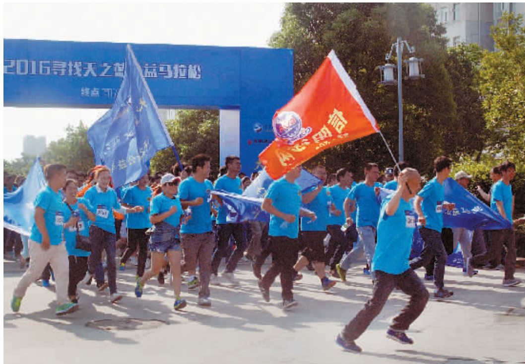
为关注环保事业,用行动代替围观,用行动为赢回蓝天,5月29日,由河南电视台都市频道主办的大型户外马拉松“寻找天之蓝——益动起来”乐跑活动在我市茗阳阁举行。我市共有300多名选手参加了此次活动。图为活动现场。

本报讯(记者 聂品)5月23日至25日,由国家旅游局、联合国世界旅游组织、河南省政府共同主办的2016中国(郑州)国际旅游城市市长论坛在郑州国际会展中心举行。本次论坛共有来自36个国家的98位旅游城市市长或者市长代表,国内35个旅游城市的市长参加。我市组建25人的旅游行业代表团参加了本次论坛各项活动。本次活动我市现场发放招商手册1200余份,发布招商项目27个,拟引资金额134.25亿元。市政府、光山县、新县、鸡公山管理区等签约信阳市青山绿水航空小镇、新县生态旅游度假酒店、联兴万亩油茶生态农业观光园、鸡公山国际艺术园等4个重大旅游合作项目,协议投资总金额71亿元,排在省辖市前列。 为借助2016中国(郑州)国际旅游城市市长论坛这个推广平台,今年年初以来,我市进行北京至广州2趟高铁7种媒体冠名“信阳旅游号”,经停京广高铁沿线所有省会城市。今年4月份又在郑州东站站厅层和交通厅投放20多块“信阳旅游”户外大型灯箱广告,以超震撼画面宣传。同时,南湾湖、黄柏山等4A级景区在郑州地铁站、公交站等公共区域投放户外广告。高频率宣传映入与会活动各位嘉宾、代表的视线,“山水信阳·休闲茶都”旅游城市形象赢得了好评。