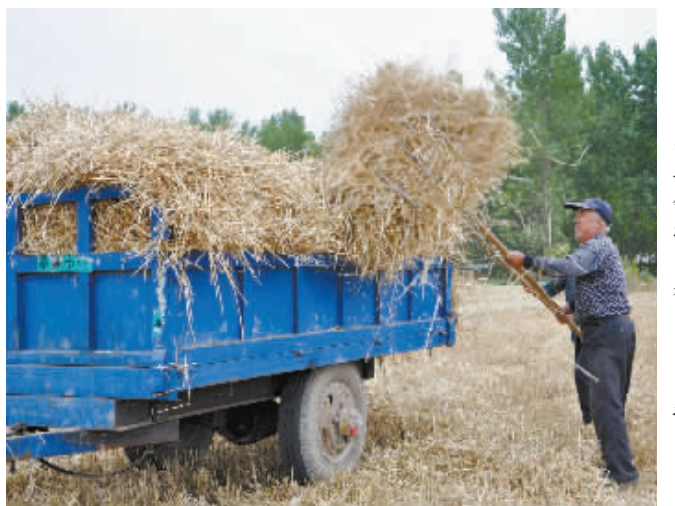
目前正处在小麦收割季节,我市不少县区乡镇鼓励农户自主收集运输秸秆,易地堆放或送往秸秆回收企业。图为昨日平桥区肖店乡赵庄村村民正在田间用拖拉机收集麦秆。

用。对达不到作业技术的机械和违规驾驶操作人员令其限时整改,保障农机安全生产。 截至目前,该区组织悬挂了宣传横幅8条,发放秸秆禁烧宣传单1000余份,推送并群发了秸秆禁烧的科普微博、微信、短信40余条,成功制止了秸秆焚烧现象1起,将秸秆禁烧工作落到了实处。