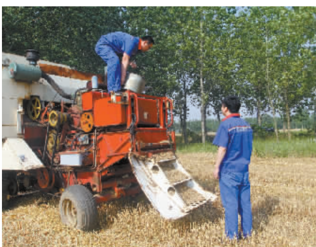
中石化信阳公司针对“三夏”时节雨天多的特点,开展“三夏青春行动”,送油到田间地头。图为昨日中石化淮滨分公司给缺油的收割机送去优质油品。耿春华 摄