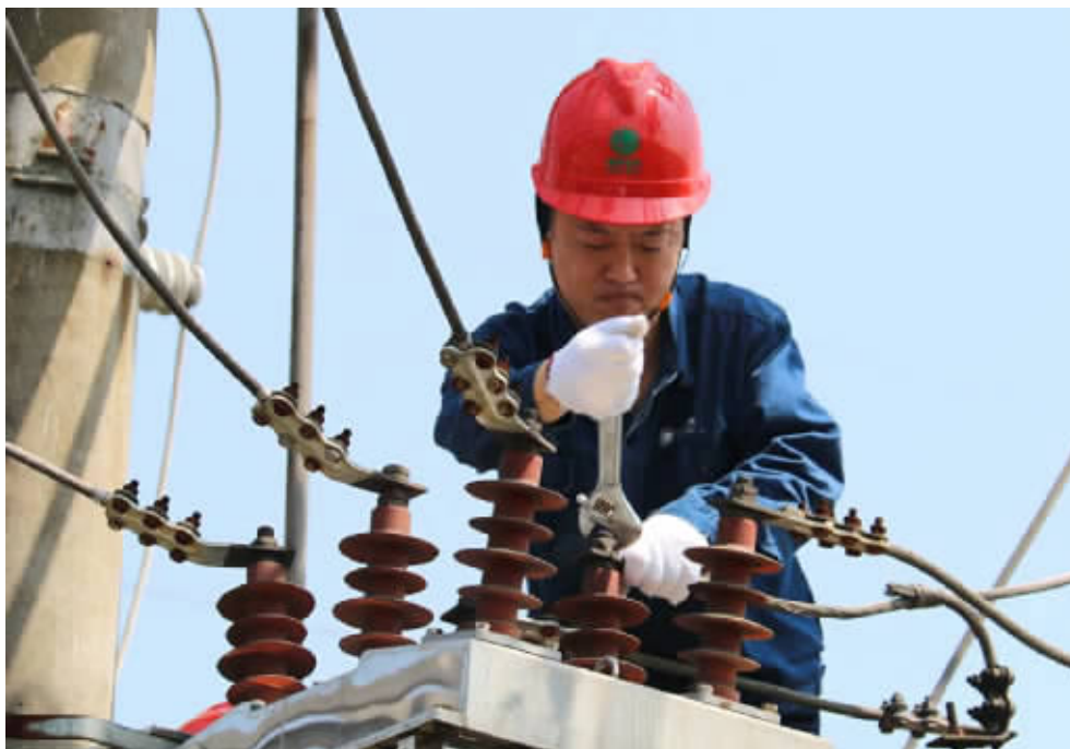
5月17日,光山县供电公司组织精干力量更换变电站各个设备,排除供电隐患,备战度夏用电高峰。