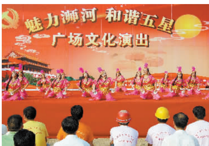
丰富多彩的社区广场文化演出

2013年4月,按照“条块结合、资源共享、优势互补、共驻共建”模式,五星街道办事处党工委率先在全区推行街道社区大党(工)委制建设,构建区域化大党建工作格