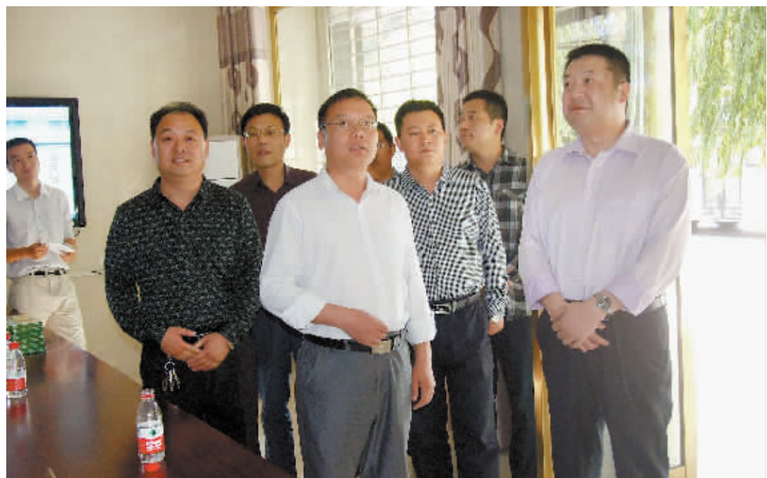
市委组织部有关负责同志调研五星办事处大党工委建设

目前,五星街道社区大党工委与驻区单位党组织签订共建共驻协议31份,全年确定共建服务项目72个。信阳师院组织大学生志愿服务队进社区开展“送文化科技、送政策法律”等活动10余次,师院内的体育文化场馆免费为辖区居民开放;市特种设备检测中心定期为辖区单位、小区家属院进行电梯、锅炉安全使用大检修;区人社局积极发挥劳动就业培训中心的职能优势,为拱桥、平西、河南路社区的失业农民、下岗职工举办电商就业技能培训10期,培训人员达800余人次,拓宽了居民就业增收渠道,帮助指导70余人实现了再就业。