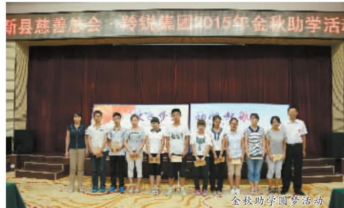
金秋助学圆梦活动