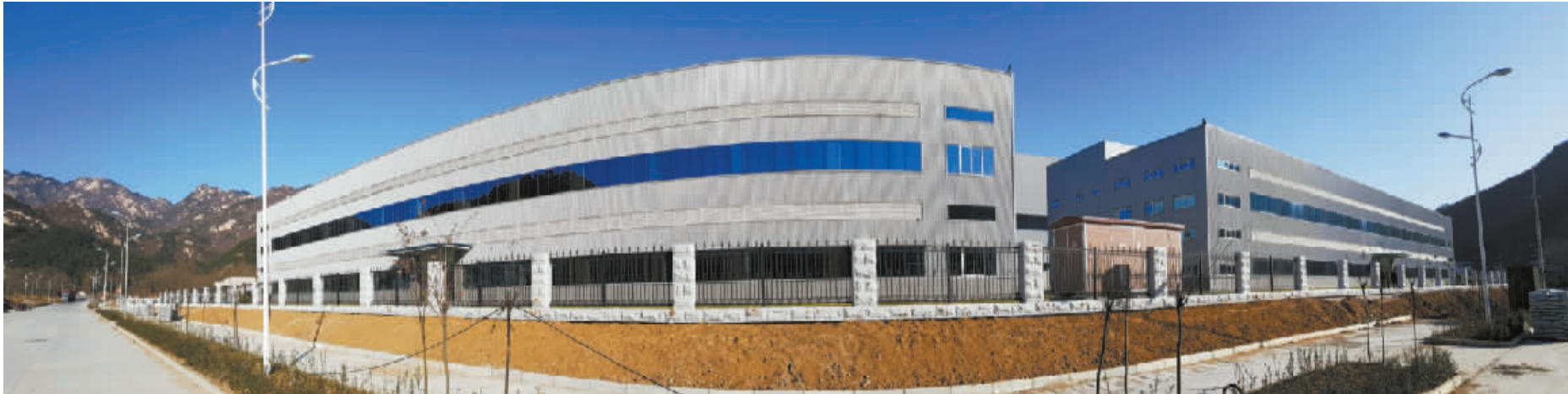
羚锐暖洋洋生产基地