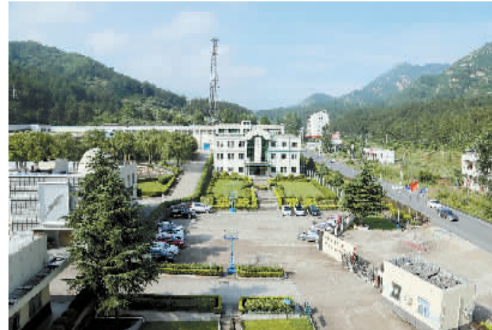
羚锐制药生产厂区