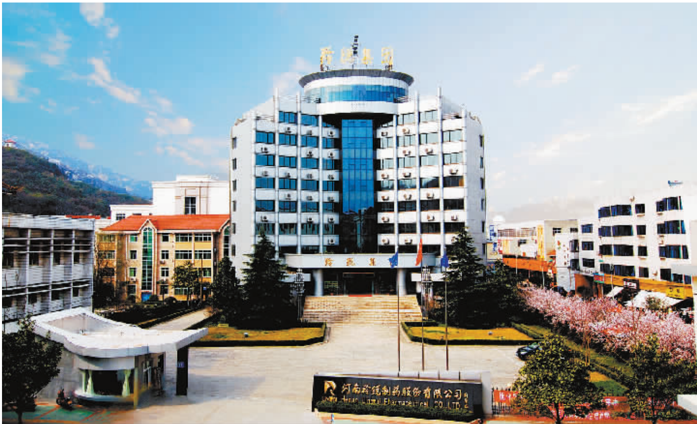
羚锐集团总部大楼

4月19日至20日，履新不到半月的河南省省长陈润儿赴信阳，驻马店调研脱贫攻坚工作。产业扶贫是加快大别山革命老区脱贫致富的关键举措，也是陈润儿此行调研的一项重要内容。他深入扶贫龙头企业羚锐集团实地考察，对当地“扶持一个企业发展，带动一方百姓脱贫”的做法表示认可，并要求有关部门研究政策，吸引更多有条件的企业面向贫困人口招工、到贫困地区办厂。