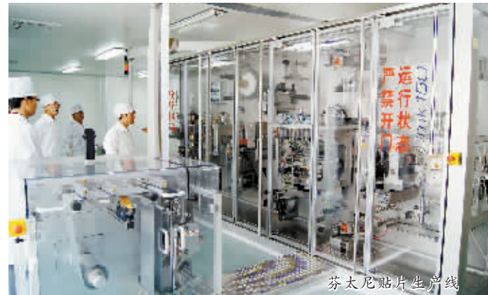
芬太尼贴片生产线