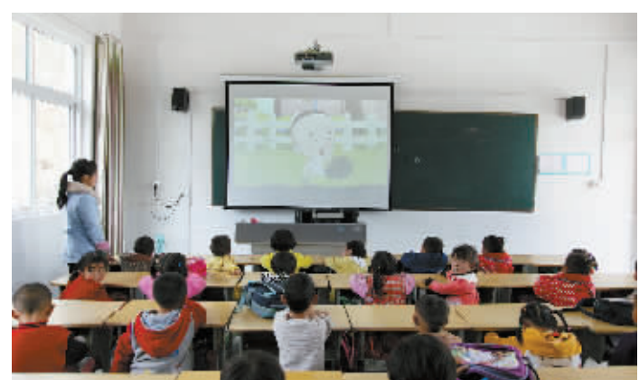
自2014年,我市实行全面改善贫困地区义务教育薄弱学校基本办学条件(简称“全面改薄”)以来,农村教育取得了新成果。图为昨日河南省最南部的一个山村学校——新县田铺乡八一爱民学校前班的老师正在运用多媒体设备进行教学。本报记者 冯康松 摄

本报讯(关大功)“不拦截火车,不冲击铁路,不破坏、盗窃、损毁和移动铁路线上的设施、设备,火车的运行速度大大提高,铁路安全形势日趋严峻。为击打列车……”近日,潢川县第十二小学的操场上,随着全体师生举起右手郑重承诺,定城中心校“珍爱生命,远离铁路”宣传教育活动全面展开。 潢川县定城中心校辖区的4所小学均分布在宁西铁路沿线,学区居民及子女长期邻路而居。随着宁西铁路的改造升级,火车的运行速度大大提高,铁路安全形势日趋严峻。为提高学生的爱路护路意识,避免伤亡事故发生,确保铁路安全畅通,定城中心校携手武汉铁路局麻城公安处潢川车站派出所,开展了以“珍爱生命,远离铁路”为主题的宣传教育活动。