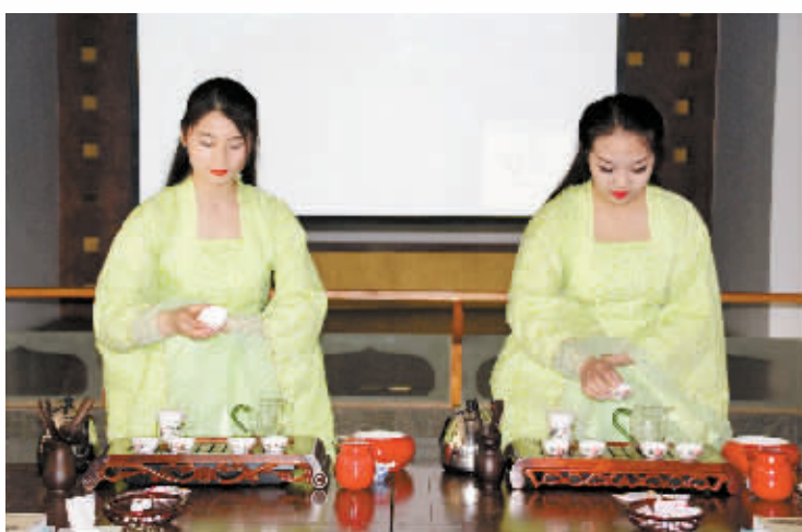
适逢春茶开采时节,很多外地游客来信阳参观茶园、采摘茶叶、观看茶艺表演,这已经成为信阳的一道靓丽风景线。它不仅有利于宣传信阳的茶文化,同时也带动了经济发展。图为茶艺师正在表演茶艺。