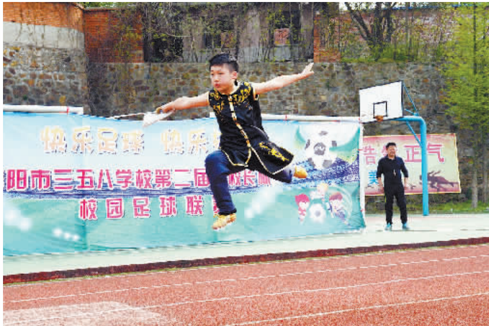
近日,三五八学校举行了第二届“校长杯”校园足球联赛启动仪式。本次足球联赛共有24支队伍参加,男队16支,女队8支,赛事历时一个月。图为启动仪式上的文艺表演。本报记者 马迎春 摄

教育信息化发展。按照规定征足、管好、用好教育费附加和地方教育费附加,土地出让金收入按规定比例用于教育,义务教育经费向薄弱学校倾斜。 狠抓管理,着力促进教育内涵发展。该县秉持“抓管理、重规范、促养成、创特色”的办学理念,深入推进义务教育阶段学校行为习惯、高效课堂、阳光大课间、汉字书写、高效阅读、兴趣特长“六大工程”的实施,提高中小学生的综合素质。广泛开展校园足球活动,办好“县长杯”校园足球联赛。坚持重科研、提质量、出特色、创名校的理念,深化普通高中课程改革,推进普通高中多样化发展。坚持长短结合方针,深化产教融合、校企合作,推进现代职业教育发展。 坚持常抓不懈,着力打造和谐平安校园。该县实行局领导包片、股室长包乡镇学校的校园安全管理责任制,强化各级各类学校校长的第一责任。深入开展安全教育,加强安全隐患的排查与整改工作,保障教育教学设施安全。强化校车安全管理,确保学生交通安全。强化学校日常安全管理工作,加强校园安全防范能力建设。 强化正风肃纪,着力加强党风廉政建设。该县加强《准则》《条例》的学习,开展“两学一做”活动,筑牢教育系统广大党员干部党纪国法意识。强化制度刚性约束,巩固深化党的群众路线教育实践活动和“三严三实”专题教育成果,努力形成常态化长效化机制,为教育改革提供保障。