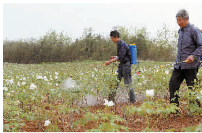
4月9日,泌阳县吴家店镇十里村油用牡丹种植示范园牡丹花盛开,吸引不少游客前去游览拍照。据悉,油用牡丹不仅具有观赏性,也有十分可观的经济效益,该示范园种植面积约400亩,种植区整体规划近万亩,可解决2000人就业。图为十里村村民正在给油用牡丹喷洒农药。

会议指出,一是把学习贯彻《准则》《条例》作为落实全面从严治党主体责任的重要抓手,通过开展“两学一做”学教活动,进一步强化党员干部的党章党规党纪意识。二是持续深化作风建设,在抓常、抓细、抓长上下功夫,严防“四风”反弹,在管好党员干部的同时,切实加强了对党员干部配偶、子女、亲属的教育管理。三是认真落实好党委主体责任,把主体责任层层压紧压实,领导班子成员认真履行“一岗双责”,对职责范围内的党风廉政建设负主要领导责任,切实做到业务工作分管到哪里,党风廉政建设就跟进到哪里。四是加强纪检监察队伍建设,主动适应新常态,把政治纪律和政治规矩挺在前面,敢于在监督执纪问责中动真碰硬,对群众反映的突出问题,发现一起查处一起,绝不手软。