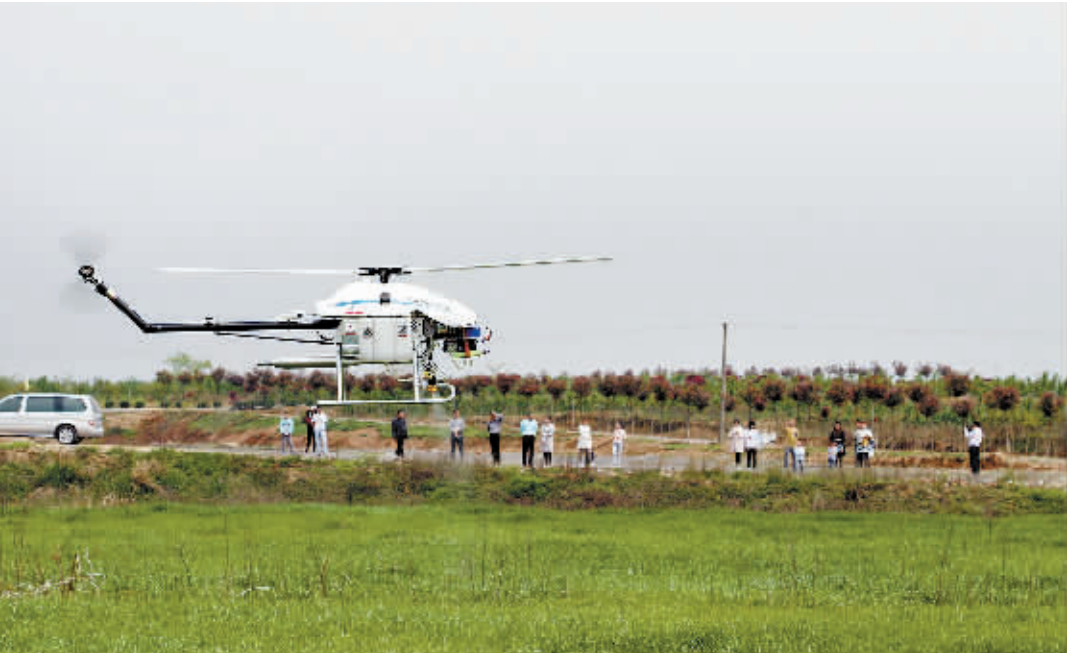
4月11日,光山县世旺生态农业专业合作社用无人植保机给农作物喷洒除草剂,大大提高了生产效率,降低了农业种植成本。

新型职业农民,让他们再去带着大家干、做给大伙看,增强服务的针对性和有效性,提高科技服务的质量和效益。三是积极构建农业科技自主创新与推广格局,扎根县区,创建亮点,培育一批现代农业产业示范典型。四是利用网络平台,不断扩大服务范围,将科技产品和科技服务以现代方式推送给更多的农民,提高服务的时效性。五是给农民送去实实在在的“科技大餐”,达到服务的目的和培训的效果,为农业插上“科技翅膀”。