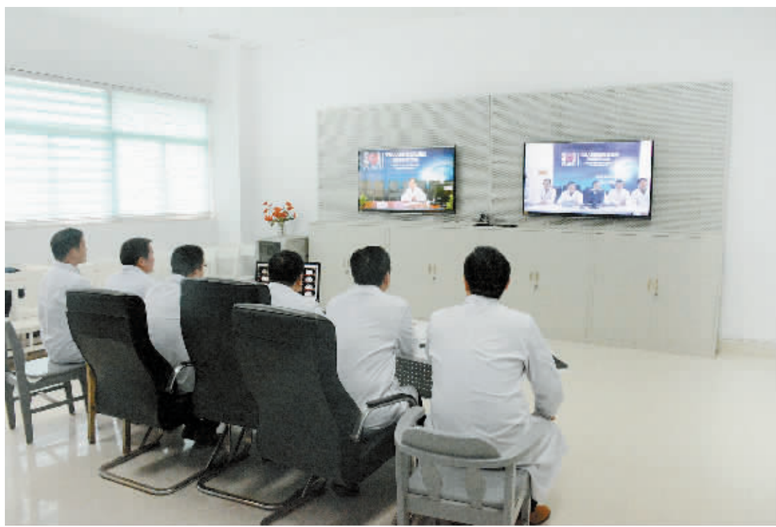
商城县人民医院医生与解放军301医院专家进行远程会诊。

2015年6月27日,商城县普降暴雨,导致商城县南部乡镇山洪暴发,山体滑坡等洪涝灾害。此次洪灾商