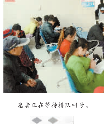
患者正在等待排队叫号。