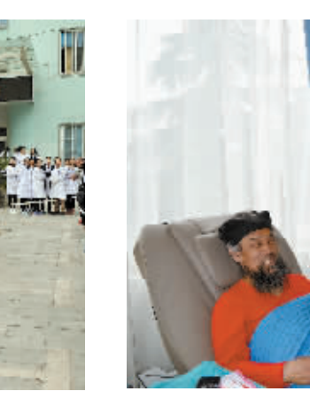
日前,市中心血站来了一位特殊的献血者,他是新县金山圣母宫的道长,道号天然子。为了庆祝自己60岁生日,他从新县专程来到市中心血站捐献血小板。1996年以来,他累计捐献全血2次,捐献血小板近百次。