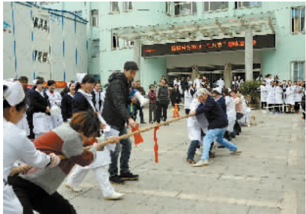
近日,信阳职业技术学院附属医院举办趣味运动会,300余名女职工分别参加了拔河、踢毽子、绑腿跑等项目。同时,该院还选派女职工参加学院运动会,取得了踢毽子和跳绳团体一等奖的优异成绩。