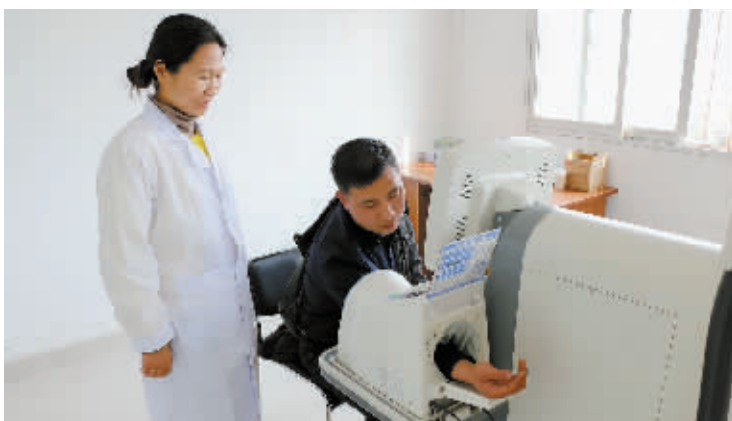
图为五里店办事处社区卫生服务中心工作人员正在调试健康体检一体机。

公共卫生健康关系到一个国家或一个地区广大群众健康的公共事业。随着人类交流和联系的日益密切,一些重大疾病尤其是传染病(如禽流感、SARS等)的预防、监控和救治引起全社会的高度关注。“云计算”在平桥区的全面实施,对全面掌握本地区公共卫生信息发挥着无可替代的作用。