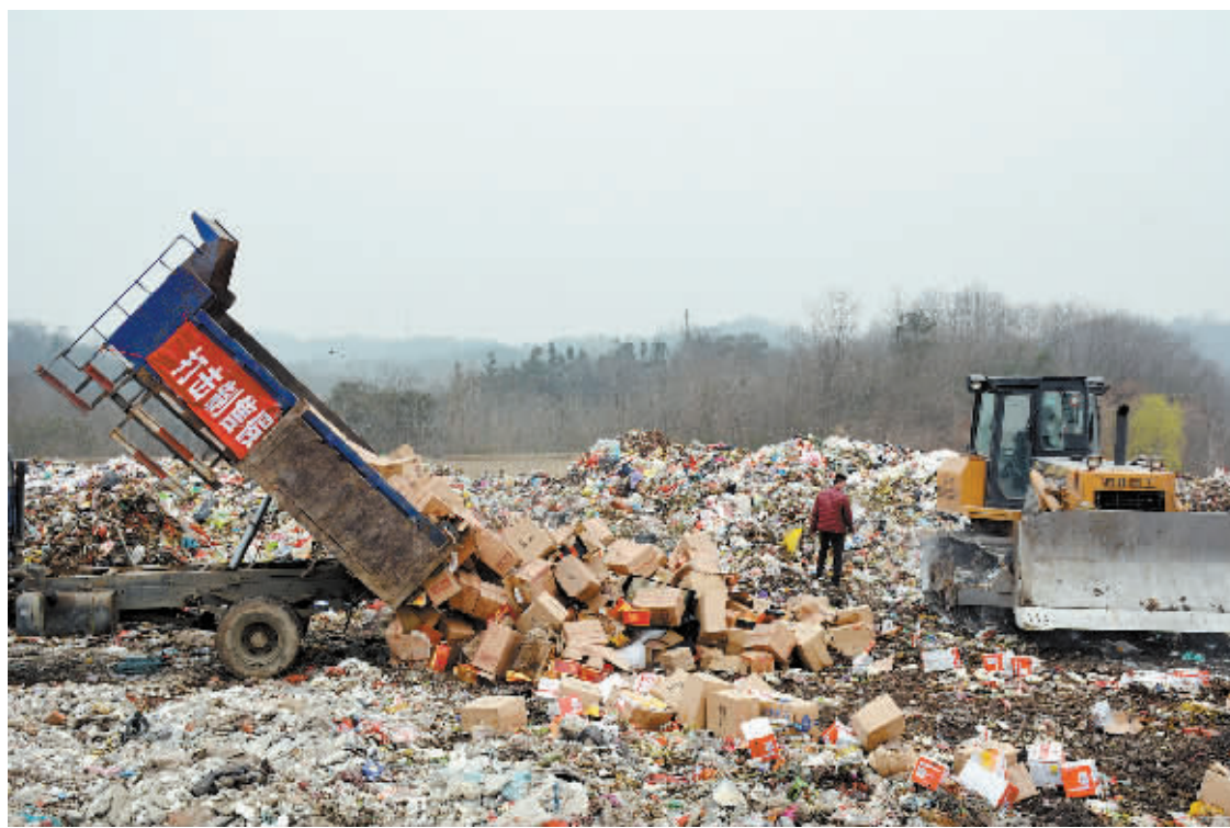
为引导人们理性消费、依法保障个人权益,市工商局、市消费者协会联合开展打击制假售假行动。图为3月15日市执法部门在将没收的假冒伪劣商品销毁填埋。本报记者 马童 摄