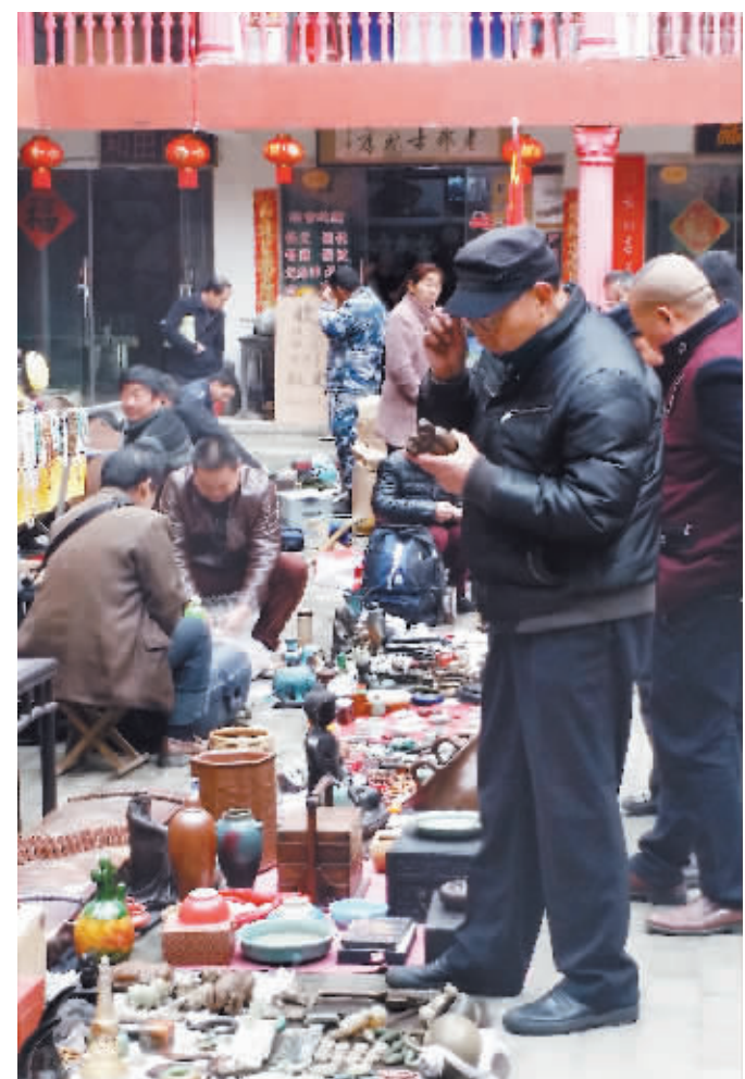
坐落在市内的文庙大成殿,始建于元代,是市区仅存的古代建筑。近几年,这里已形成一个较为集中的古玩市场,每到节假日来这里淘宝的市民络绎不绝。图为周日市民们在此欣赏挑选古玩。