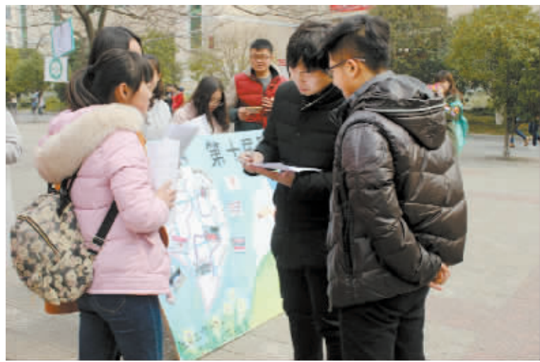
3月15日是国际消费者权益日。当日，信阳师范学院社会工作协会组织2014级、2015级社会工作班举办了以“发展社会工作，助人你我同行”为主题的第十届国际社日活动，吸引众多学子参与。