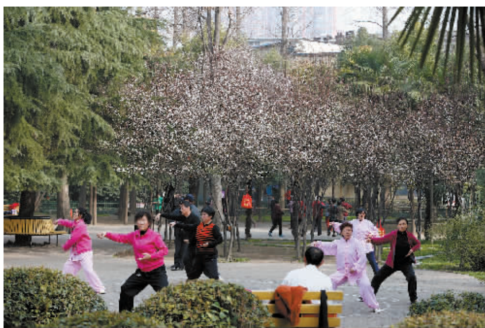
“正能量”文明信阳 新闻摄影大赛 信阳日报社 协办单位:信阳正和集团

张德江指出,实现“十三五”发展目标任务、夺取全面建成小康社会决胜阶段的伟大胜利,离不开各级人大及其常委会的积极作为和责任担当。我们要坚定坚持党的领导、人民当家作主、依法治国有机统一,紧紧围绕党和国家工作大局积极履职尽责,扎实开展各项工作,以良法促进发展、保证善治。(下转第二版)