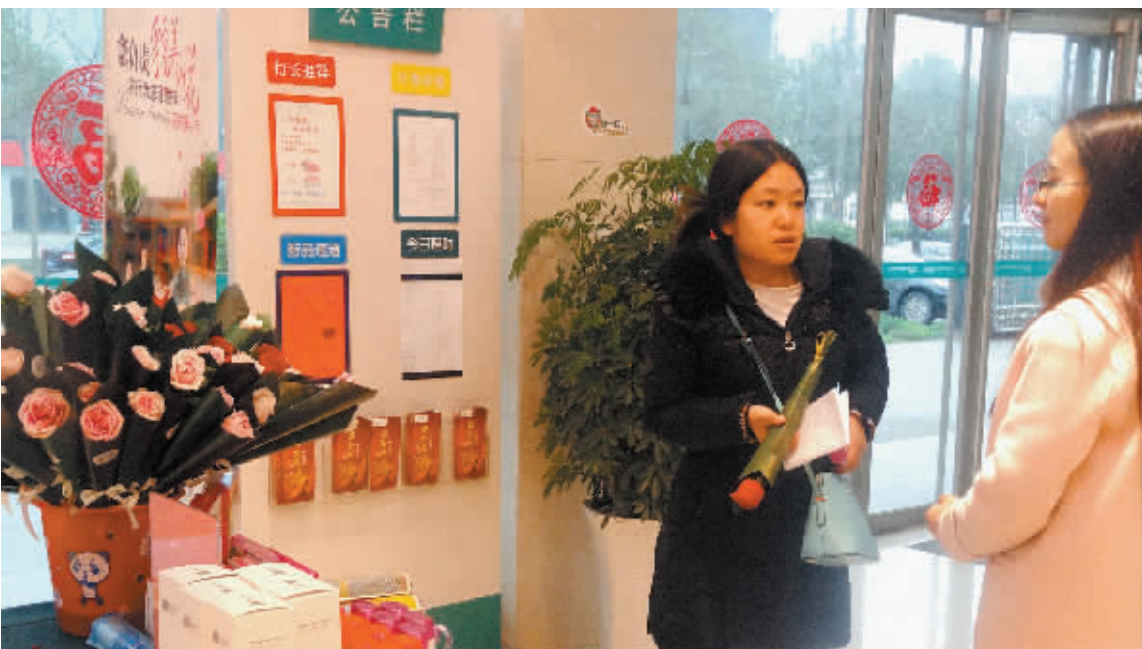
为庆祝“三八”妇女节，昨日，市农行创新金融服务，在17个市区网点和28个县域城区网点，向前来办理业务的每一位女性客户赠送了玫瑰花、小方巾、化妆品、洗发水等礼品。

“十二五”时期，我省城镇中低收入家庭“住有所居”渐行渐近；农村危房改造让越来越多的农村住房困难群众享受到党和政府的温暖。全省开工建设各类保障性住房1.9亿平方米，244万套，竣工3787万平方米，60.9万套，改造农村危房超过100万户。今后一段时期，随着我省新型城镇化进程加快推进，棚户区