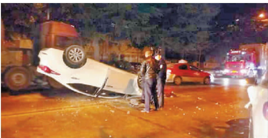
2月23日晚上9点左右,一辆白色现代轿车在107国道军韵花园东门口与一辆轿车相撞后逃逸至107国道,又在市中级人民法院门口撞上一辆白色途观车后翻车。交警及时赶到处理现场,幸无人员伤亡。肇事车车主疑似酒驾,目前事故正在进一步处理中。