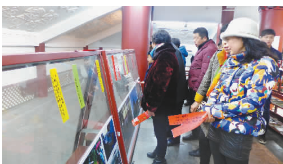
2月22日至23日,历勘影视文化传媒公司、中伯楼民俗文化艺术展览中心在我市滨河八景之一的中伯楼举办“民俗表演,猜灯谜”活动。为期2天的活动中,共吸引千余名群众参与。主办单位为猜中谜底者准备了近千份精美礼品,大家在猜谜活动中享受着传统文化带来的乐趣。