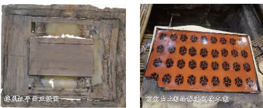
前室出土髹漆耳杯组合

本报讯(见习记者 郭晓雨)昨日，记者从省文物局获悉，2015年度全国十大考古新发现评选活动初评已于近日启动，我省有4项考古发现进入总数为38项的初评环节。我市的信阳城阳城址八号墓入选，其他三个入选的分别是河南灵宝许昌人旧石器遗址、伊川徐阳春春秋墓地、洛阳汉魏洛城太极殿遗址。