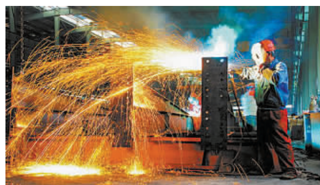
中科钢构生产车间

风劲帆满图新志,砥砺奋进正当时。“2016年是‘十三五’开局之年,我们将坚持稳中求进,务实作为,持续推进招商引资,完善要素保障,优化发展环境,不断推进产业集聚区持续健康快速发展,加快工业强县步伐,为美丽乡村、文明城镇、幸福商城建设增添新动力,为商城人民添福祉。”谈及未来,商城县委书记李高岭如是说。