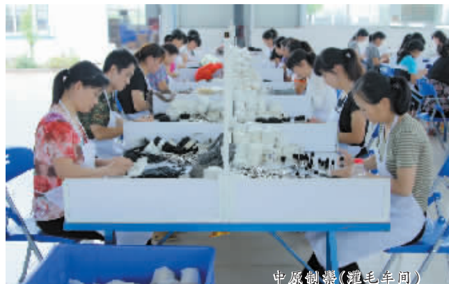
中原制器(耀毛车间)

在招商方式上,商城县产业集聚区坚持“请进来”和“走出去”两条腿走路,建立健全外出商会招商机制,积极采取商会招商、驻点招商、以商招商等办法,不断开展集团化、体系化招商,提高招商工作的精准化水平。该县计划在三年至五年内,将集聚区打造成为河南省环保装备制造产业基地。