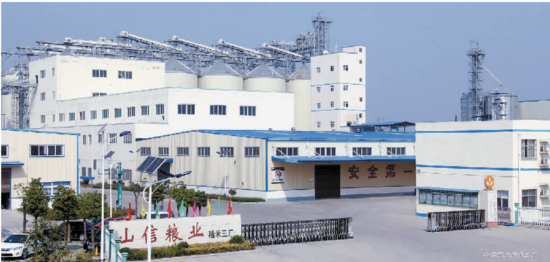
山信粮业稻米三厂

“十二五”期间,商城县委、县政府认真贯彻落实省委、省政府和市委、市政府的决策部署,坚持把产业集聚区作为带动全局的战略举措来抓,全县各级各部门紧密结合各自实际,持续加大支持力度,完善工作举措,破解发展难题,着力在对外开放招商、提高承载能力、创新体制机制、培育产业集群、强化集约节约、健全保障体系上下功夫,产业集聚区建设为该县突破传统农区格局、实现转型升级发展开辟了道路、积累了经验,为该县“十二五”期间工业发展交上了一份喜人答卷。