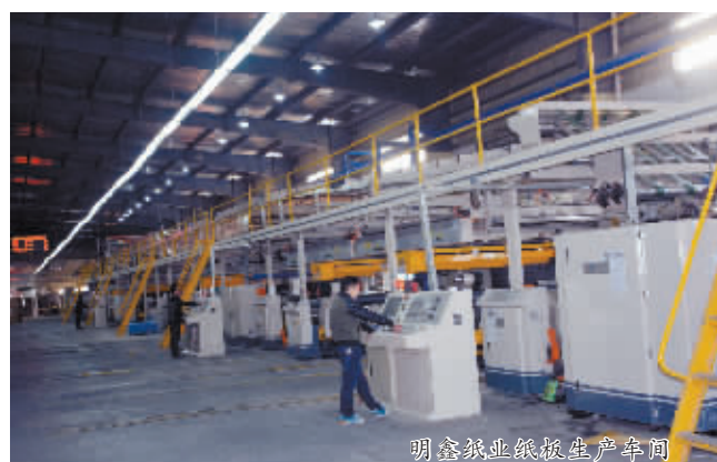
明鑫纸业纸版生产车间