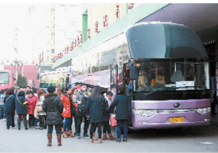
▲图为信运汽车站旅客有序乘车。 ▲2016年春运期间,为确保广大群众能够“安全出行、平安返乡”,信阳火车站通过强化优质服务、畅通购票通道、扩大候车容量、更新导向标识等多种方式为旅客出行提供温馨和便利的服务。图为该站工作人员帮助旅客顺利登车。