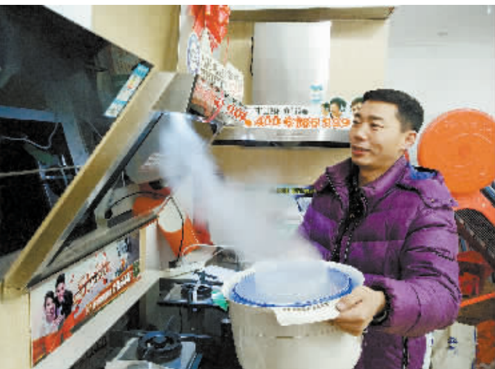
实验人员端来一个锅式加湿器,置于灶台上,通电加热,腾腾热气瞬间被吸个精光。将加湿器搬离灶台一定距离,效果亦然。