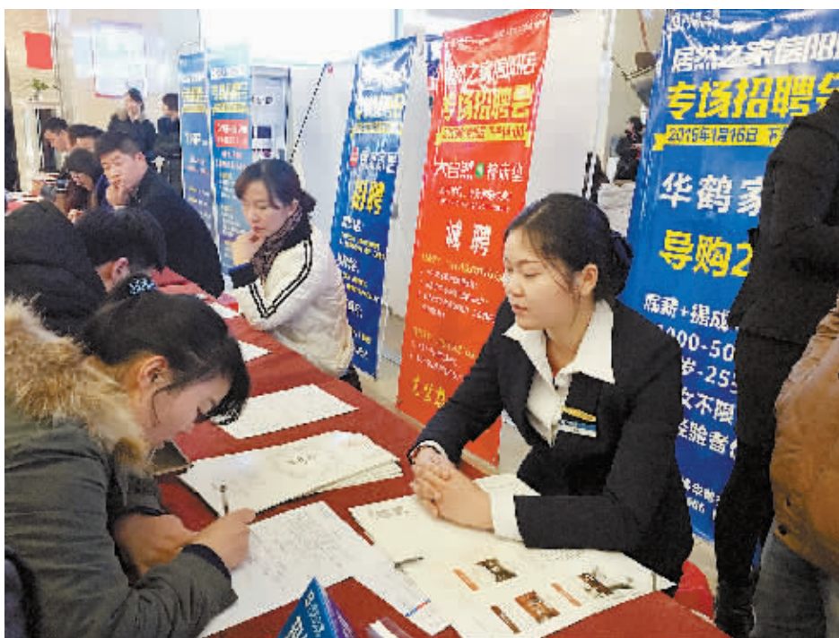
1月16日,居然之家信阳店举行专场招聘会,现场人潮如织,各品牌负责人热心地为应聘者详细介绍工作环境及薪资待遇。据了解,很多家居建材品牌当天就招到不少优秀人才。