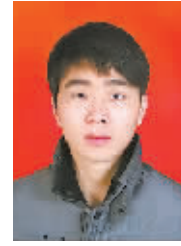
平安财险 黄 冠