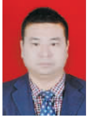
中国人寿 李 新