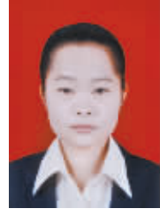
中华联合 马 雁