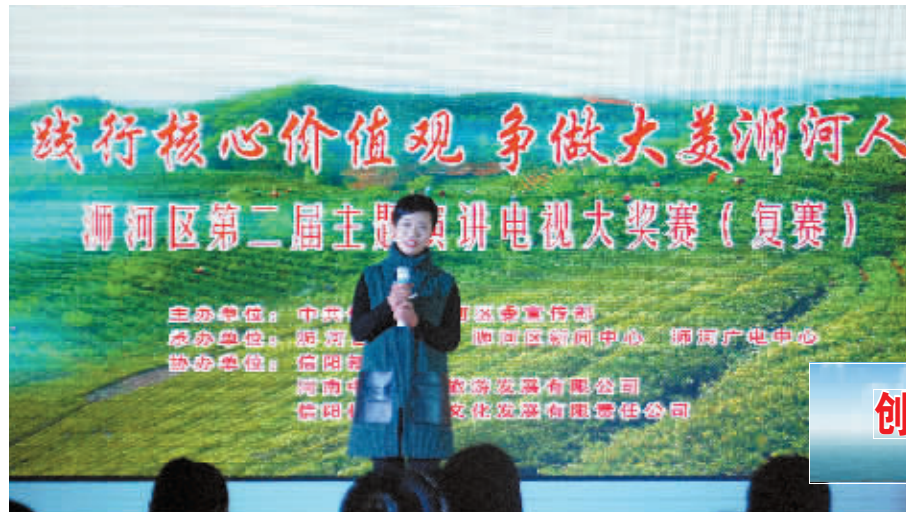
创建全国文明城市

昨日,为推进全国文明城市创建工作,浉河区第二届“践行核心价值观·争做大美浉河人”主题演讲电视大奖赛(复赛)举行,演讲内容包括生活的体验、人生的感悟、读书的心得和典型的推介。共有76名选手参加了比赛。因为比赛现场。