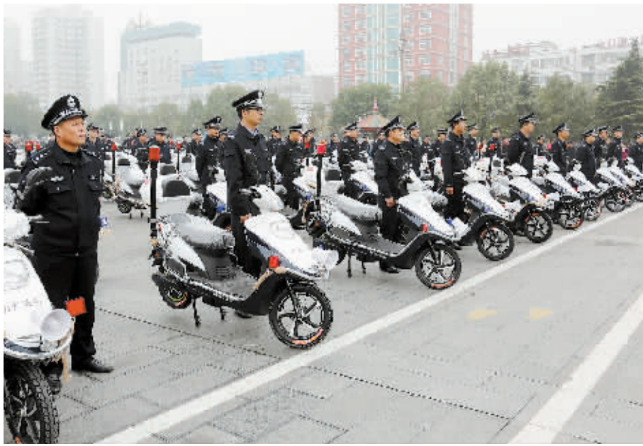
11月9日，市委政法委、市综治委在平桥区举行了治安巡防电动车发放仪式，再次配发平桥区103辆巡防电动车。该批巡防电动车的投入使用，将进一步扩大巡防范围，切实提高人民群众的安全感和满意度。

监督考察频率以共性考察为主，个性考察为辅。刑事诉讼法规定了附条件不起诉的考验期限范围，