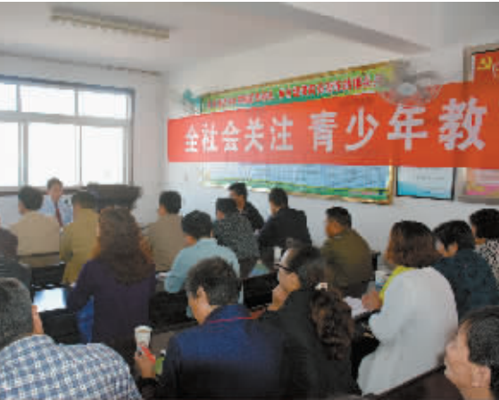
近年来,光山县检察院积极开展“每季度读一本书”活动,进一步激发了干警“比学习、比干劲”的活力,全院已形成文化育检的浓厚氛围。图为该院干警正在读书研讨时的情景。

市场经济秩序等犯罪,积极参与社会管理创新工作,强化社会矛盾纠纷源头治理,有效预防和减少了社会矛盾。 注重强化法律监督,维护公平正义。该院不断规范监督行为,改进监督方式,对裁判不公、执法不严等突出问题,适时开展专项监督。 注重加强自身建设,促进廉洁公正执法。该院大力开展规范司法行为专项整治活动,进一步规范执法办案行为。不断强化检察队伍管理,加强领导班子建设,狠抓纪律作风和反腐倡廉工作,着力提升检察队伍拒腐防变能力和检察机关执法公信力。 件,纠正漏捕、追诉、书面纠正违法等侦查活动监督的案件进展情况。同时还出台了《关于刑事案件适时介入工作办法》,对检察机关介入案件的类型、时间、程序等作出了明确规定。 为解决刑事侦查工作中存在的问题,该院与县公安局建立了联席会议制度,通过讲评案件的方式,互相通报刑事侦查中存在的取证不及时、不规范非法证据等问题,减少执法办案中的分歧,提高诉讼的效率。双方还建立了交流学习制度,适时互派业务骨干到对方业务部门学习交流。