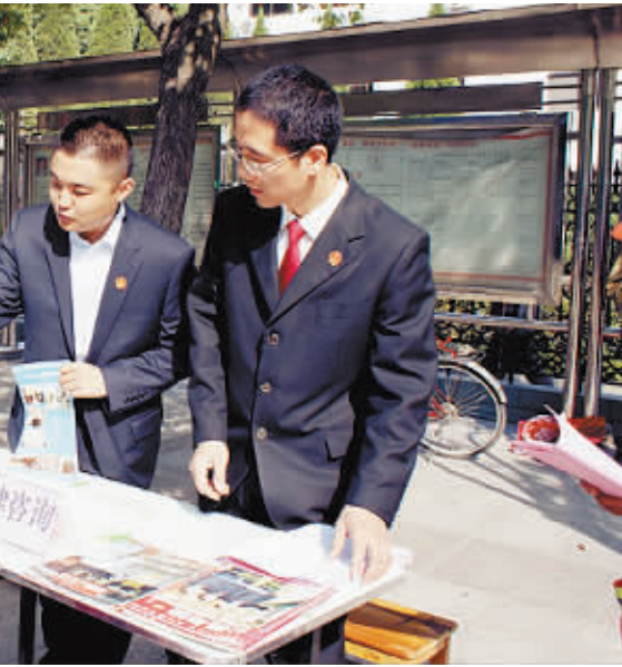
日前,息县法院积极开展平安建设法治宣传活动,通过现场提供法律咨询、发放法律宣传资料等方式,向广大人民群众宣传婚姻家庭、邻里纠纷、起诉立案、青少年犯罪等法律知识。