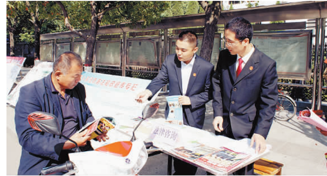
日前,息县法院积极开展平安建设法治宣传活动,通过现场提供法律咨询、发放法律宣传资料等方式,向广大人民群众宣传婚姻家庭、邻里纠纷、起诉立案、青少年犯罪等法律知识。