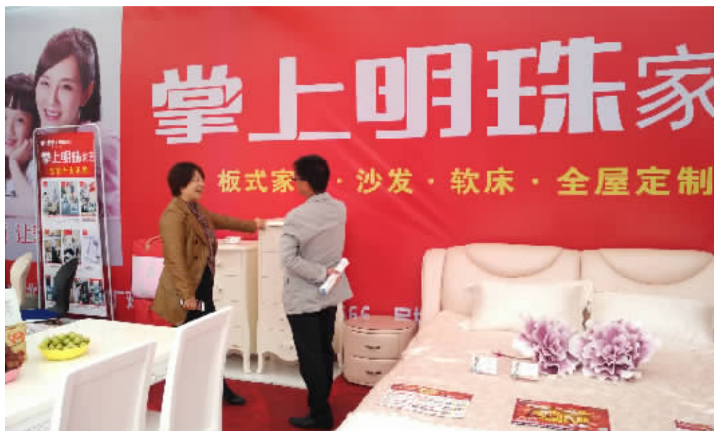
在9月30日开启的“2015中国信阳金秋时尚生活展”上,掌上明珠家居“大美至简”的产品品质,给参观者留下了深刻印象。图为掌上明珠家居展区内,消费者在向店家了解家具的设计理念、材质、价格等情况。

国庆节第一天:冷餐茶歇——各种美味的糕点、水果、饮料免费享用。第二天:插花DIY——玫瑰、百合、康乃馨、太阳花、水晶草、黄莺……每一种是不是都喜欢呢?第三天:寿司DIY——还在回味上次寿司DIY的小伙伴们,这次可以吃个够!第四天:彩绘陶罐DIY——各式各样的陶瓷存钱罐,让你挑花眼!第五天:彩绘帆布包——五颜六色的彩绘帆布包,背着逛街、购物,美观又实用。第六天:自制披萨DIY——如此美味的食物,怎么能错过?第七天:沙画DIY——小画家们,快来呀!这些还不够,每天还会有大转盘幸运抽奖、百家乐博彩、X-BOX游戏机……等着您!