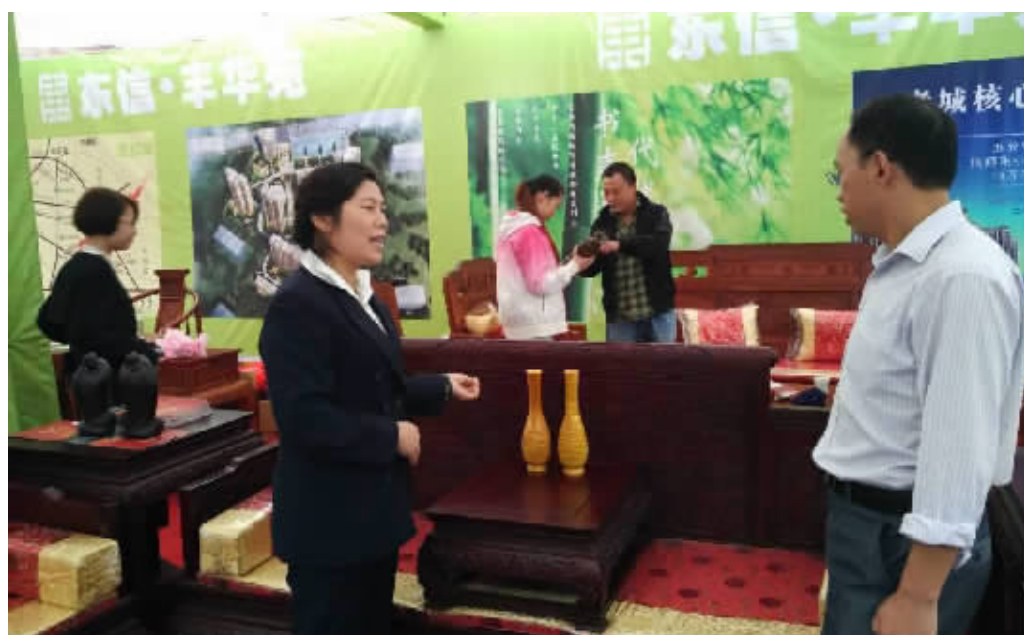
瑞祥轩是一家集研发、加工、销售为一体的大型红木家具制作企业,产品包括博古架、茶几、沙发、圈椅、官帽椅、书柜、书桌、办公桌、罗汉床、贵妃床等百余种,全部实行终身免费保养、维修。图为9月30日,在“2015中国信阳金秋时尚生活展”上,消费者在瑞祥轩展区体验红木家具,了解红木文化。