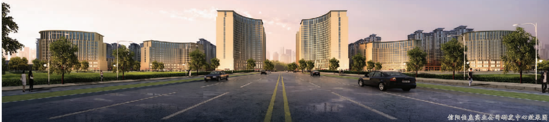
信阳伯皇实业公司研发中心效果图

信阳伯皇电子产业园及国际物流配送中心建设项目立足于信阳,选址于信阳电子产业集聚区,依托中原经济区建设条件下信阳的整体区位优势