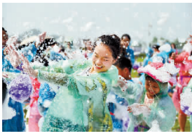
7月25日，在河南省洛阳市一薰衣草庄园，孩子们在“泡沫大战”中玩耍。 暑假里最郁闷的事，不是玩得不够high，而是再不起劲玩耍，假期就要结束啦！正所谓“无快乐不暑假”，小伙伴们快快走出家门，尽情享受暑假的快乐吧。