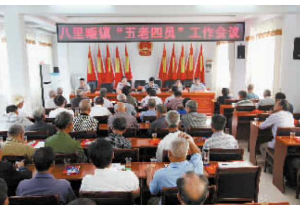
八里畝镇每月都会召开一次“五老四员”工作会议,汇总、分析全镇基层工作动态,安排下一步工作。

2014年下半年,省委把新县确定为全省基层四项基础制度建设示范点,并将新集镇、八里畝镇、吴陈河镇和郭家河乡列为示范乡镇。新县八里畝镇严格按照省委、市委和县委的要求,注重实践,大胆创新,深入实际,因地制宜,努力探索出一套“可示范、可复制、可推广”的有益经验,让好的制度在革命老区新县落地生根。