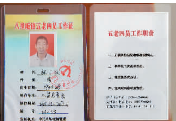
每一个“五老四员”工作证上都有该镇便民服务、矛盾纠纷排查化解和党风廉政监督电话,方便为老百姓服务。