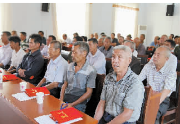
在八里畝镇“五老四员”首次工作会议上,120名“五老”人员被该镇党委聘为“四员”。