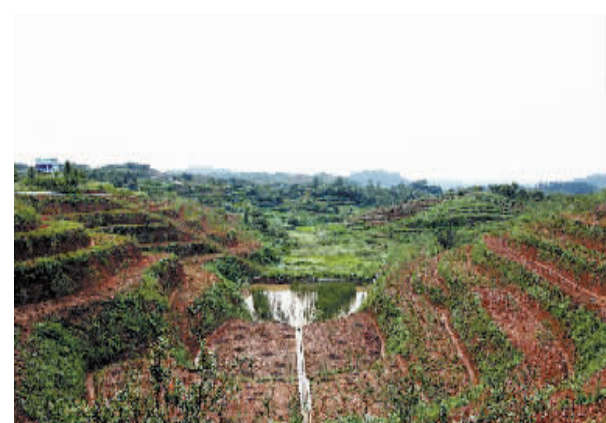
在镇村组三级干部和众多“五老四员”的共同努力下,总投资1000余万元,占地面积1000余亩的高标准美国小樱桃基地落户八里畝镇蔡山村。

(六)“五老四员”不脱离原工作岗位,每年对其工作开展情况进行考核,经考核合格的给予误工补助,考核特别优秀的给予奖励,对所负责辖区出现非访、群体性事件和重大刑事民事案件而没有及时反映和处理的,可进行追究辞退,另聘他人担任。