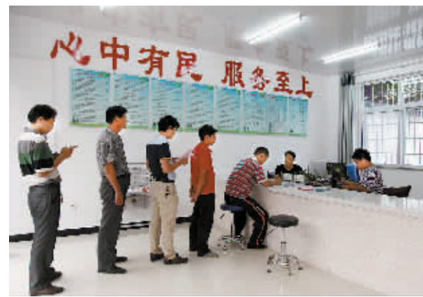
八里畝镇设立便民服务大厅,简化了办事流程,提高了办事效率,方便了办事群众,优化了干群关系。

目前,“五老四员”已成为党委政府在农村工作中的一支重要力量,抢占了思想、道德、风气主阵地,作为党委政府的代言人、公平正义的维护者、党风廉政的监督员、广大群众的主心骨,维护了基层社会和谐稳定。实际效果表明,“五老四员”工作法在提升群众满意度、增强群众幸福感、推进经济发展、维护社会稳定等方面可发挥积极作用,在不断探索总结中,也给予我们一些经验启示。一是民主决策全透明。人民群众享有决策过程的知情权、参与权和监督权。镇党委、镇政府严格规定,村级重大事项决策时,必须有该村一半以上的“五老四员”参加,改变了过去开会没人来、大事不知晓、群众不明白的局面,保证了村两委决策公开公正透明,增强了群众对村两委工作的了解,减少了不理解,缩短了党群干群距离,改善了党群干群关系。二是矛盾化解及时雨。镇村干部人员少,日常工作繁杂,解决矛盾纠纷难以及时到位,“五老四员”多是村里长辈、名人,深受群众尊敬,解决邻里纠纷等问题说服能力强,与村民同属一个村组,有问题能够及时发现、及时赶到、及时解决,不能解决的,可通过组村乡三级联动化解,“五老四员”化解一批、村调解一批、镇调处一批,把问题解决在基层和萌芽状态,实现小事不出组、大事不出村,重大问题不出乡。三是便民服务零距离。实行碎片化、网格化、标签化管理,明确“五老四员”辖区权限义务,群众遇到困难通过电话直接联系,为年老体弱村民提供上门服务,全程代办、限时办结、及时反馈,让群众好办事,为群众办好事,解决联系服务群众“最后一公里”问题。四是作风监督全覆盖。优化监督方式,壮大监督队伍,乡级部门同时接受120名“五老四员”监督,促进了党风廉政监督由“孤军奋战”向“齐抓共管”转变,伸张了公平正义、打压了歪风邪气,净化了乡土风情,切实解决群众办事“门难进、脸难看、事难办”的问题。